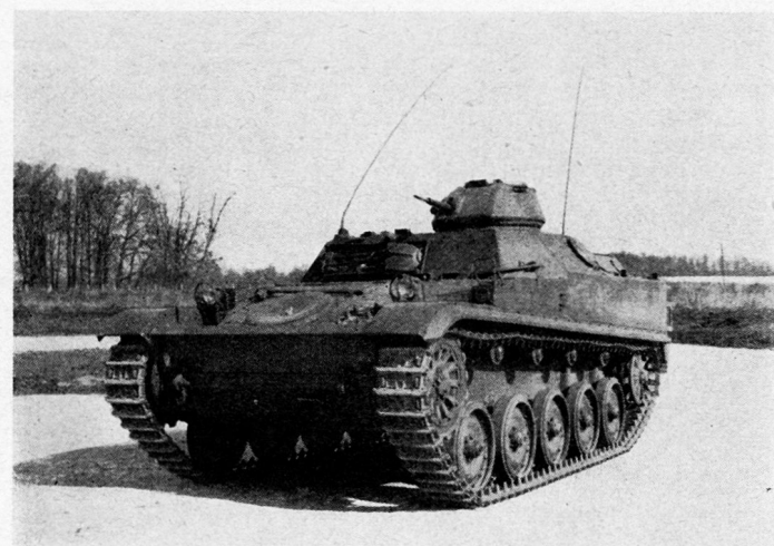
Bild 1. Ansicht von vorne

Panzerung: vorne 30 mm hinten 15 mm Seite 20 mm Türen 15 mm Dach 15 mm