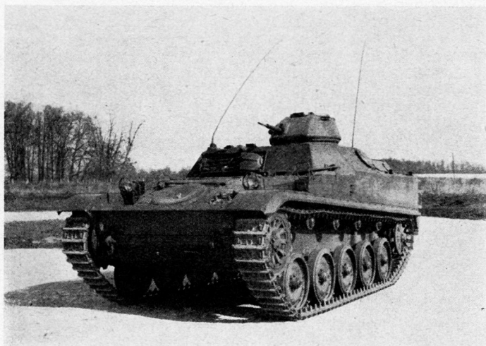
Bild 1. Ansicht von vorne