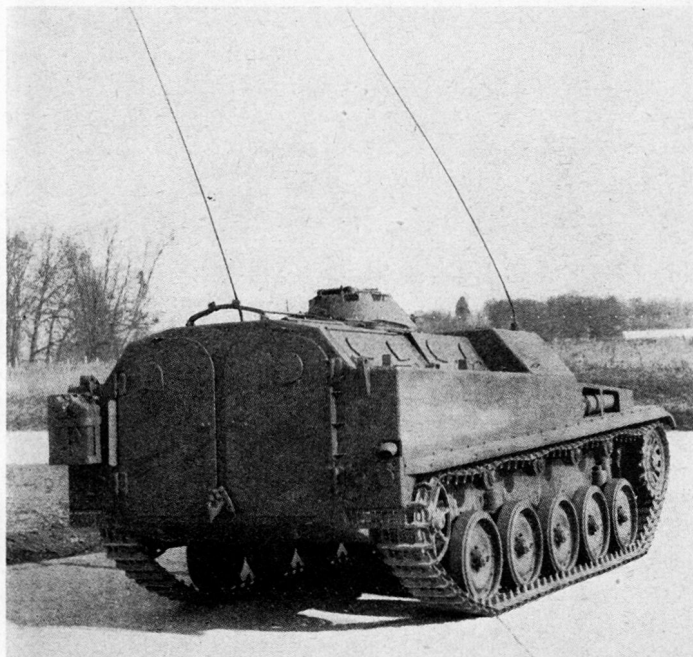
Bild 2. Ansicht von hinten

Im neuen französischen Gesetz über die Vorausplanung der Beschaffung von Kriegsmaterial sind u.a. 650 Spw. AMX vorgesehen. WM