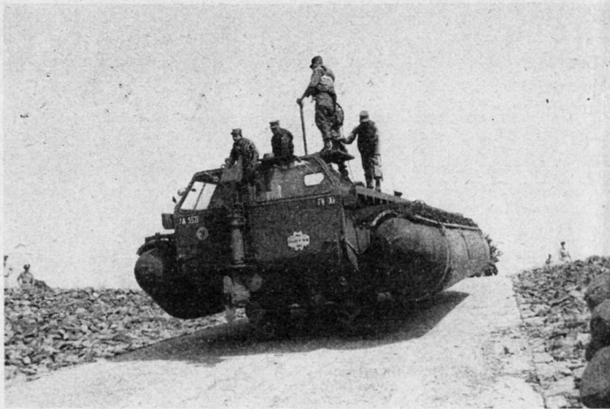
Bild 3. Amphibisches Fahrzeug

Ketten gesichert. Das Einschwenken und Zusammenkuppeln sowie die umgekehrte Operation dauern je zirka eine halbe Stunde.