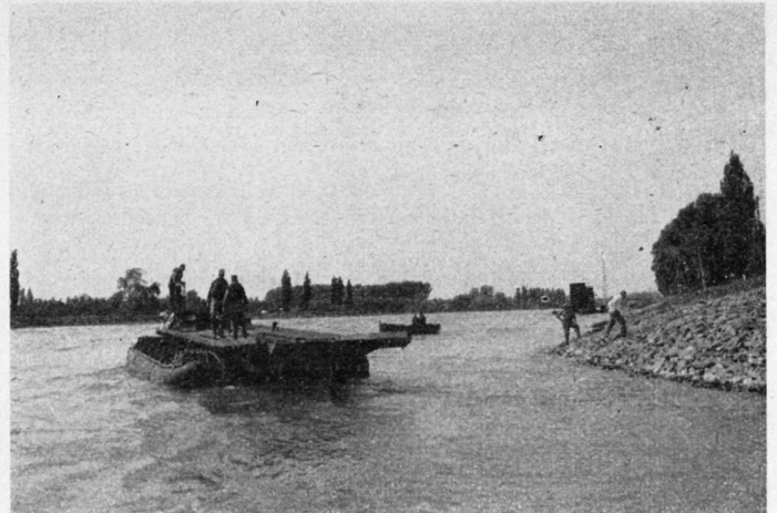
Bild 4. Fähre der Klasse 20

Die drei geschilderten amphibischen Fahrzeuge sind mit einer Geschwindigkeit von 60 km/h und einem Aktionsradius von zirka 500 km sehr beweglich. Die Geländegängigkeit ist sehr gut, und Steigungen bis 50 Prozent können von diesen Fahrzeugen befahren werden. Mo.