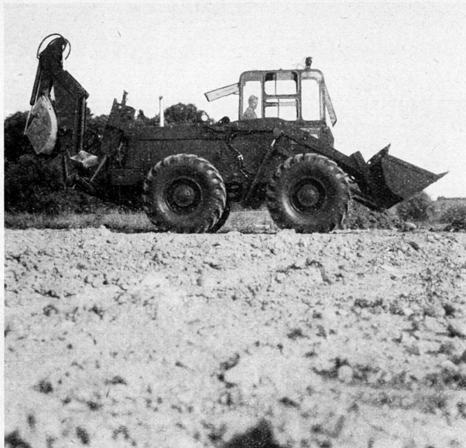
Bild 1. Military Michigan