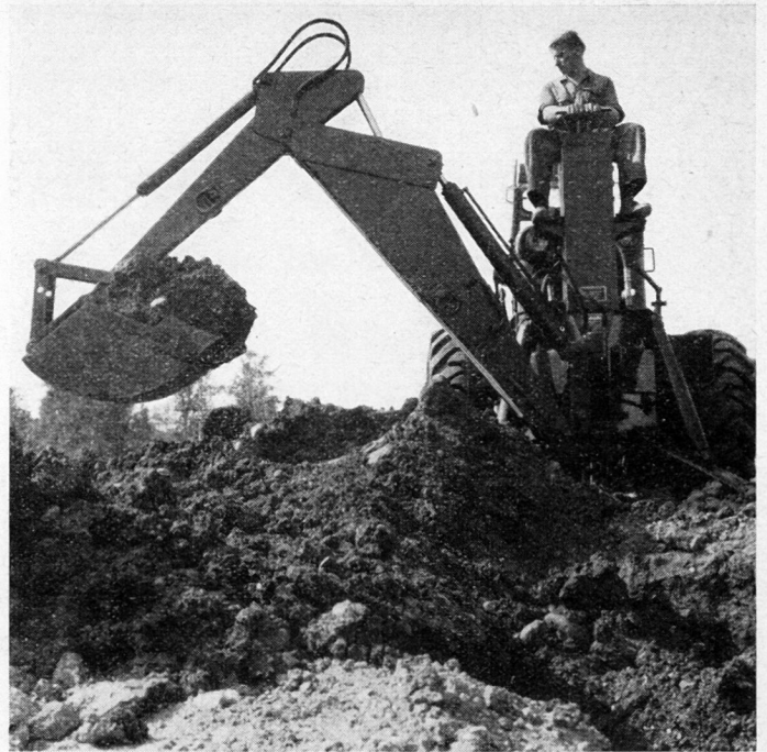
Bild 2. Tieföffelausrüstung

obwohl die Vorteile des raschen Aushubes beim maschinellen Graben von Schützengräben nachträglich oft durch umfangreiche Tarnungsarbeiten zunichte gemacht werden. Die Placierung des Sitzes ermöglicht dem Fahrer einen vollen Überblick während der Grabarbeiten.