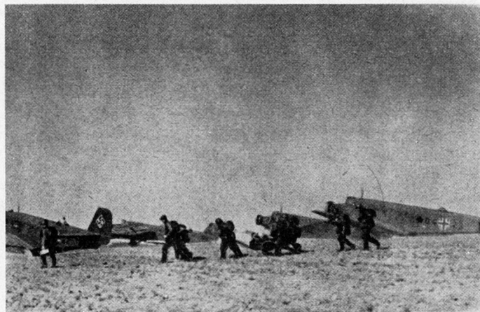
Bild 6. Gebirgsjäger der 5. Geb.Div. landen auf dem Flpl. Malemes