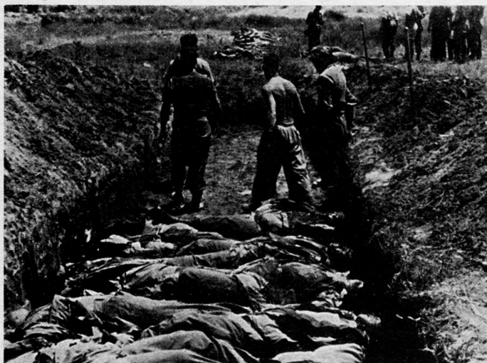
Bild 9. Die Beerdigung der gefallenen Deutschen, durch die mitkämpfenden Griechen und durch die klimatischen Bedingungen oft entsetzlich zugerichtet, erfolgte in Sammelgräbern

Der ungestümere und ungebrochene Drang nach vorwärts hatte den Deutschen den Erfolg eingebracht über die äußerst tapfere aber passive Abwehr der Neuseeländer, die sich allzu lange darauf beschränkten, ihre Stellungen zu halten, statt sofort und mit allen zusammengefaßten Kräften den vernichtenden