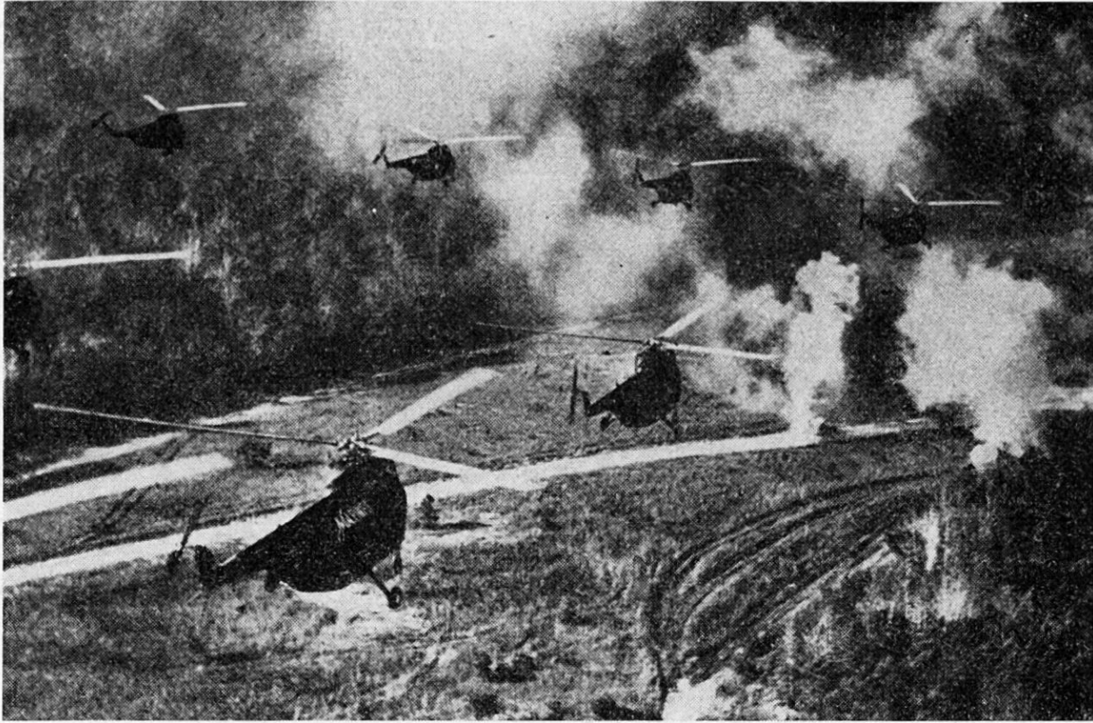
15 «S 55» sind imstande, eine kriegsstarke Füsilierkompanie samt 3 Tonnen Kollektivwaffen und Munition unversehens an einer taktisch wichtigen Stelle abzusetzen, wobei lokale Gegenwehr nötigenfalls mit künstlichem Rauch geblendet wird

teil, daß die eingesetzten Truppen mit einiger Gewähr – insbesondere nachts – wieder zurückgeholt oder verschoben werden können. Die geschickte Ausnützung dieser Beweglichkeit zusammen mit der Eröffnungsüberraschung, die jeder Luftlandung als Vorschußkapital eigen ist, verspricht schon beim Einsatz kleiner Verbände gewichtige Erfolge. Als Beispiel mag angeführt werden, daß die 61 Mann, die sich am 14./15. April 1940 von der über dem norwegischen Eisenbahnknotenpunkt Dombas abgesprungenen Fallschirmjägerkompanie schließlich zum Kampfe zusammenfanden, die strategisch wichtige Bahn- und Straßenverbindung während fünf Tagen zu sperren vermochten. Eine verhängnisvolle Schwäche, die den Luftlandungen mit den Einwegtransportmitteln anhing, nämlich die große Ungenauigkeit der Landung und die weite Zerstreuung der abgesetzten Kämpfer und Kampfmittel, fällt bei einer Helikopteraktion völlig weg. Das Absetzen von Truppen wird normalerweise örtlich sehr präzise und fast beliebig konzentriert sowie weitgehend unbehindert durch Wetter- und Geländehindernisse erfolgen.