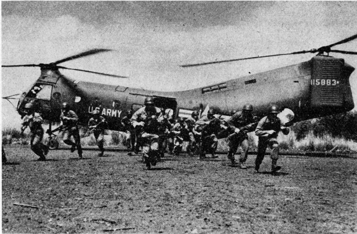
22 voll bewaffnete Füsiliere der US Army stürmen aus dem irgendwo überraschend gelandeten «Workhorse» H 21 (Vertol 44)

auch auf dem Sektor des Helikopterbaues sehr große Serien gefertigt werden.