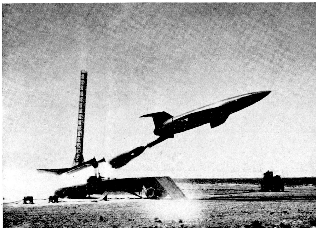
Le «Matador» quittant sa rampe de lancement sous l'impulsion de sa seule fusée de démarrage; le mât métallique à l'arrière est sans doute destiné à hisser l'engin sur la rampe.

oblique le met à une vitesse proche de celle du son, à laquelle il navigue ensuite grâce à un réacteur, atteignant un rayon d'action de l'ordre de mille kilomètres et plafonnant à 14 000 m. L'engin pèse au départ quelque 5 500 kg. Il est téléguidé du sol et son piqué sur l'objectif, également télécommandé, atteint une grande précision.