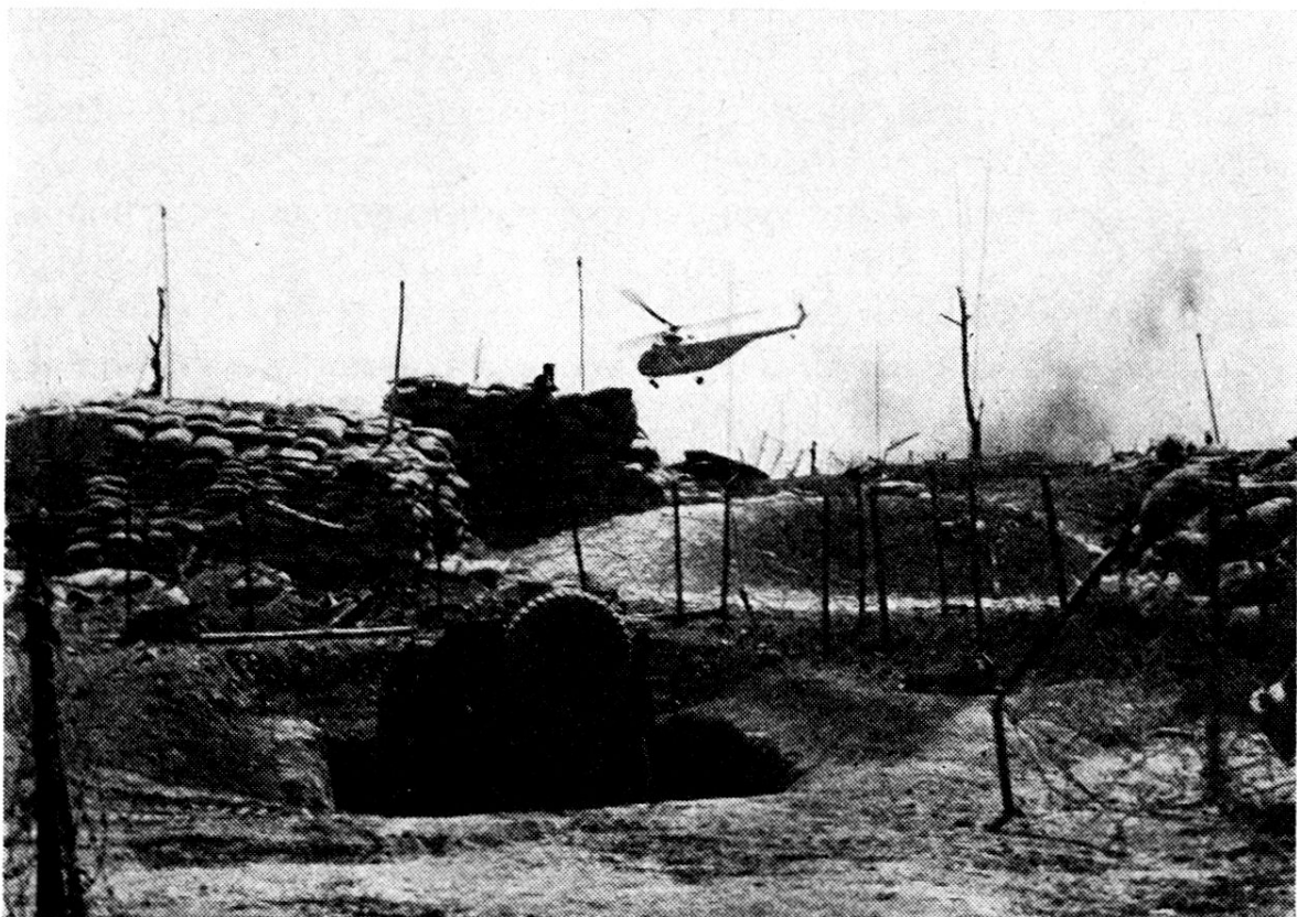
L'hélicoptère sanitaire en vol. Des abris d'où émergent des antennes sont puissamment protégés; la jeep est en partie entrée en terre.