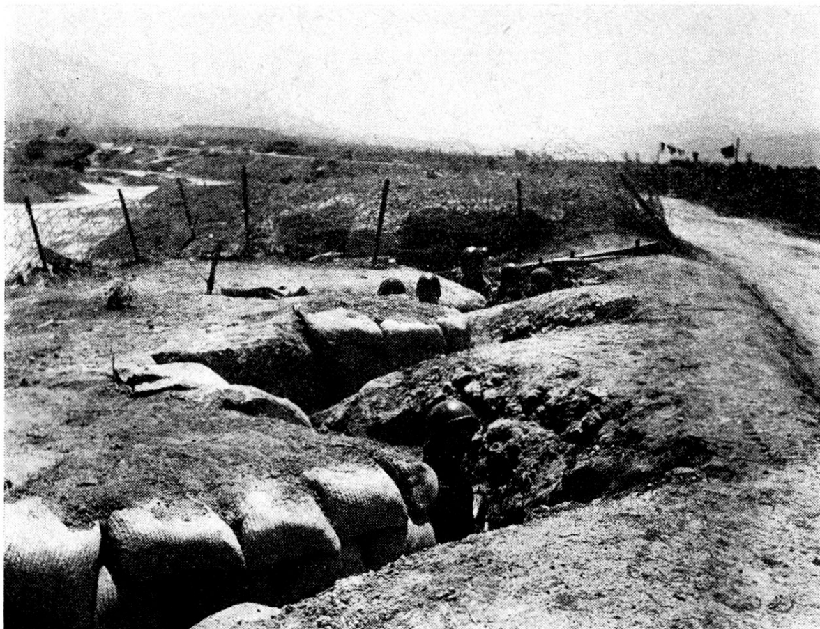
Détails de l'organisation défensive à proximité de la rivière Nam-Youm, qui traverse le camp. Un abri et un boyau en zigzag.