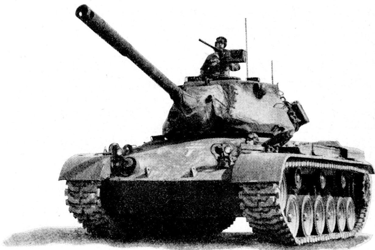
«Patton M 47» (aus «Armor» 1952 Nr. 3)

Der M 47 besitzt aktionsbereit ein Gewicht von 48,5 Tonnen, ist 8,5 m lang, 3,5 m breit und 3 m hoch. Er weist als erster amerikanischer Nachkriegspanzer wesentliche technische Neuerungen auf, die bei stärkerer Panzerung vor allem zur Erhöhung der Beweglichkeit und zur Steigerung der Feuerkraft beitragen. Das im Turm eingebaute 90-mm-Geschütz ist