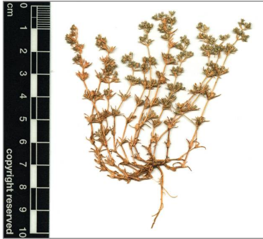
Fig.3. Exemple d'herbier de Scleranthus annuus subsp. verticillatus issu d'une culture en pot d'un individu récolté à Beurnevésin. En nature, les plantes dépassent rarement les 4-5 cm.