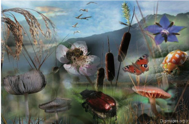
Fig. 5. Garder l'espoir devant tant de beauté !

pour les parcs, les jardins et les gazons, lutter contre les plantes invasives, mettre à disposition des espaces de loisirs, de jeu et de détente, créer des sentiers à thèmes... Un riche programme pour les dix ans à venir.