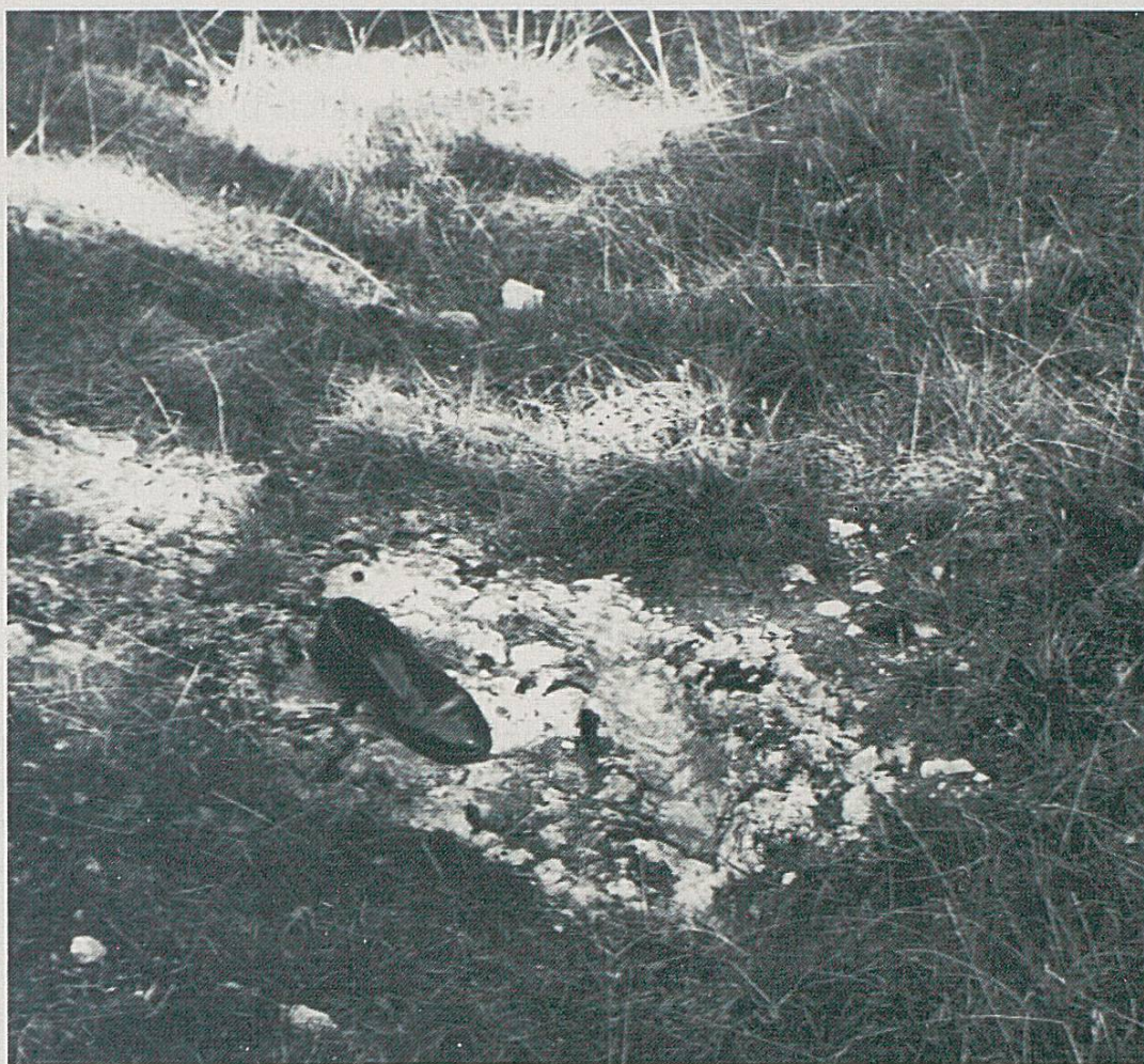
Fig. 3 Vestiges d'une ancienne route aux Tartins sur Tramelan-Dessous. Photo de l'auteur, 1977.