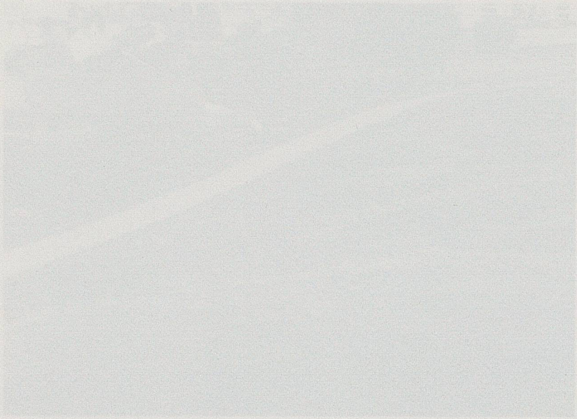
Fig. 1. Diagram of the experimental setup for the study of the effect of the concentration of the solution on the rate of the reaction.