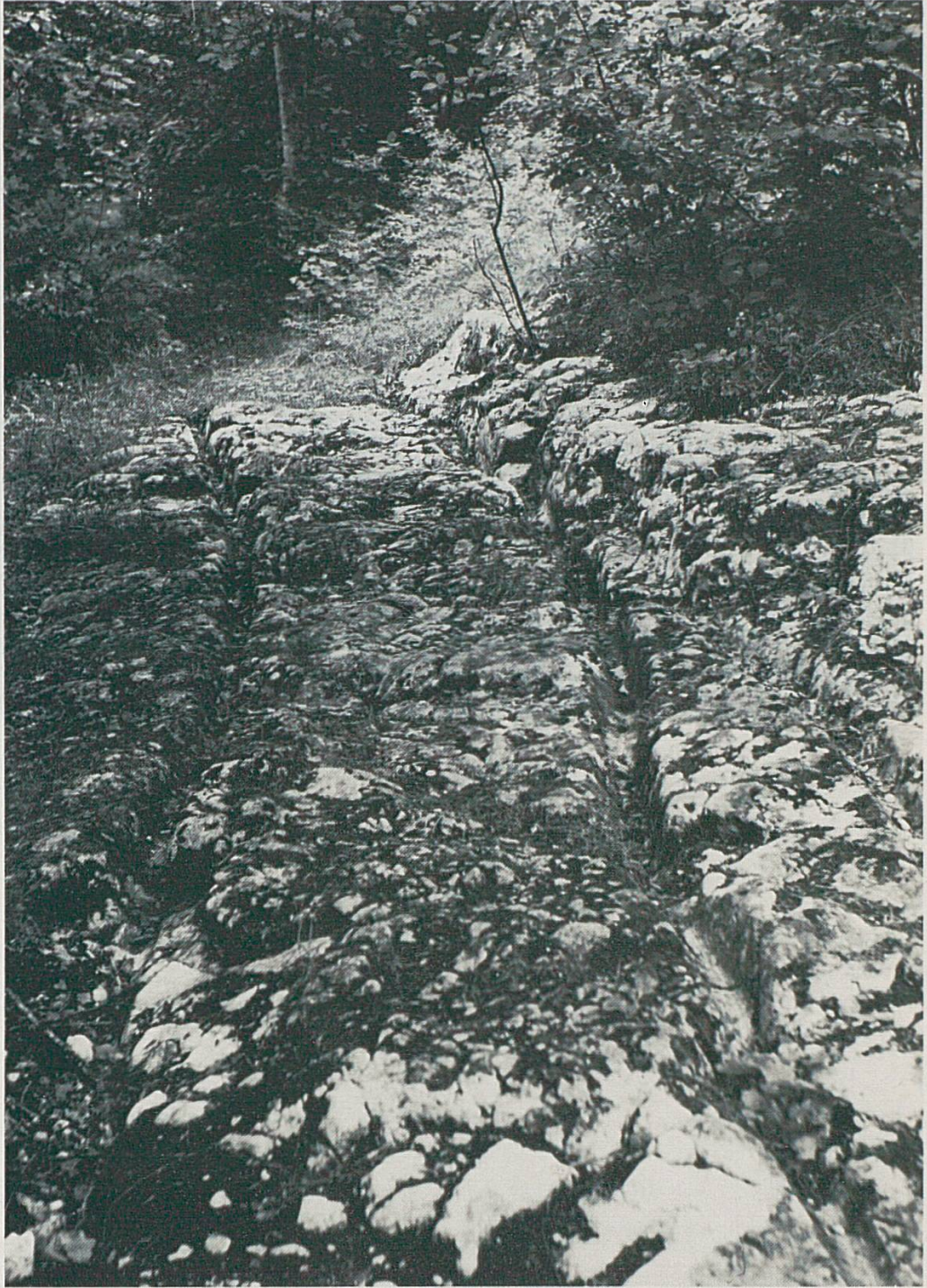
Fig. 1 Voie antique située entre Vuitebœuf et Sainte-Croix (Vaud). Photo de l'auteur, 1969.