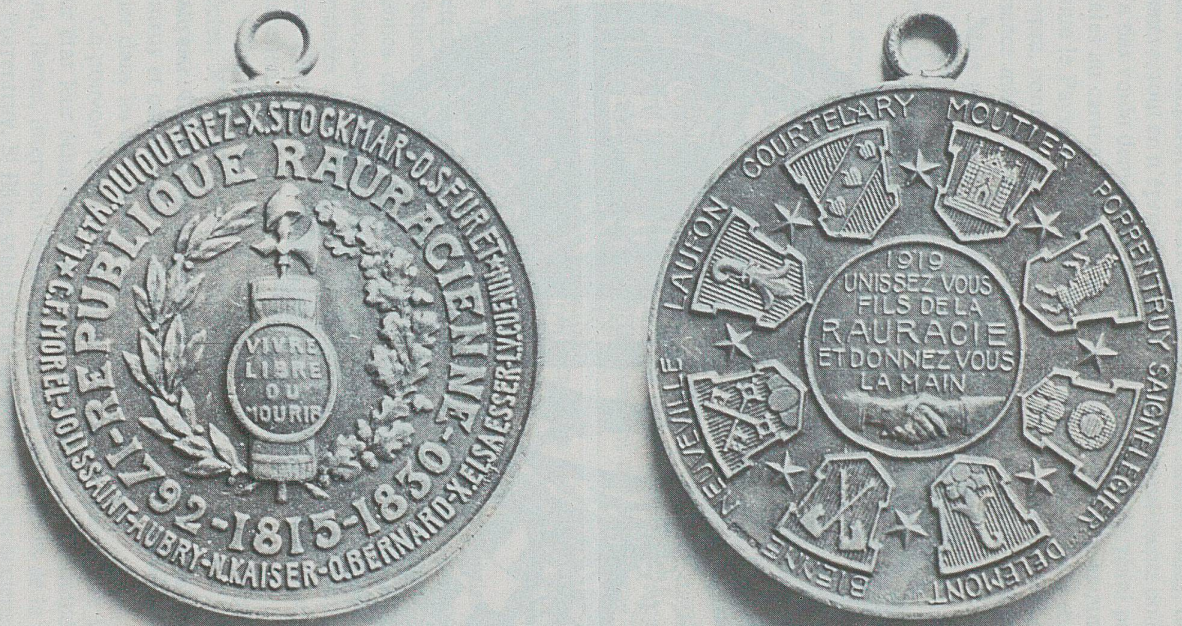
Fig. 1 — Médaille de bronze frappée en 1919.