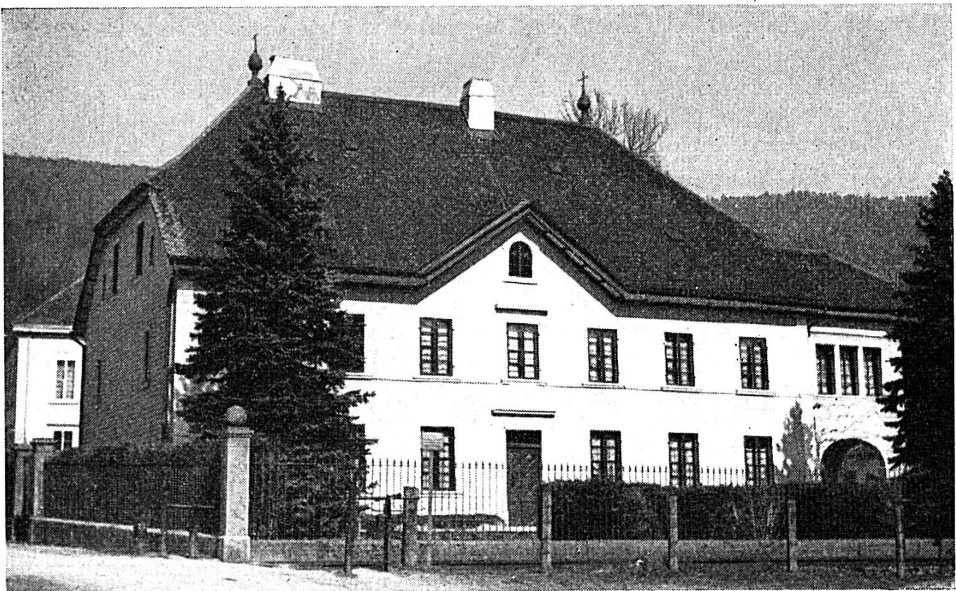
La maison Morel à Corgémont