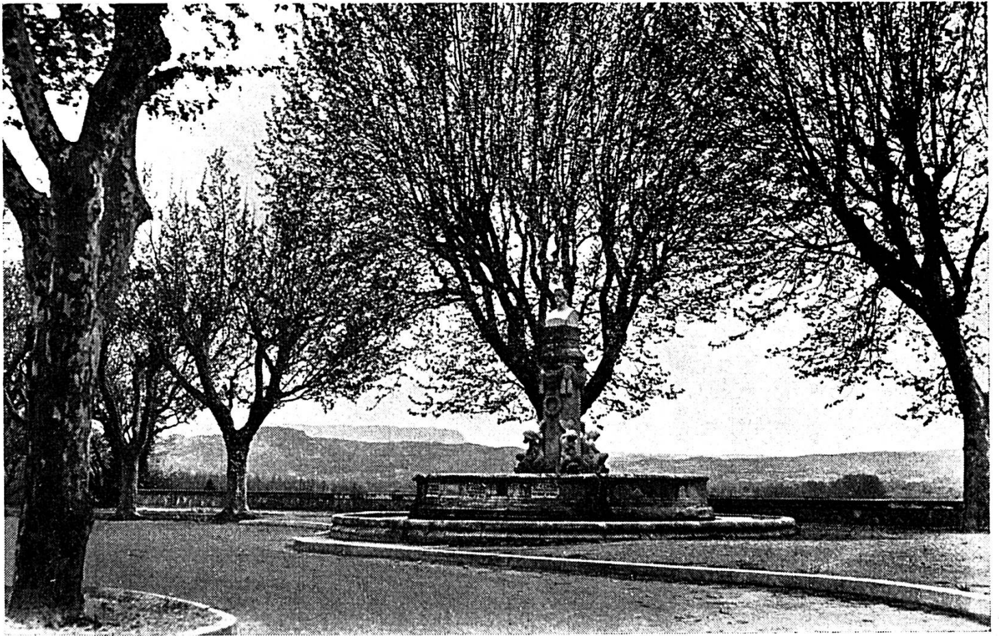
La Fontaine Morel à Pertuis, Provence