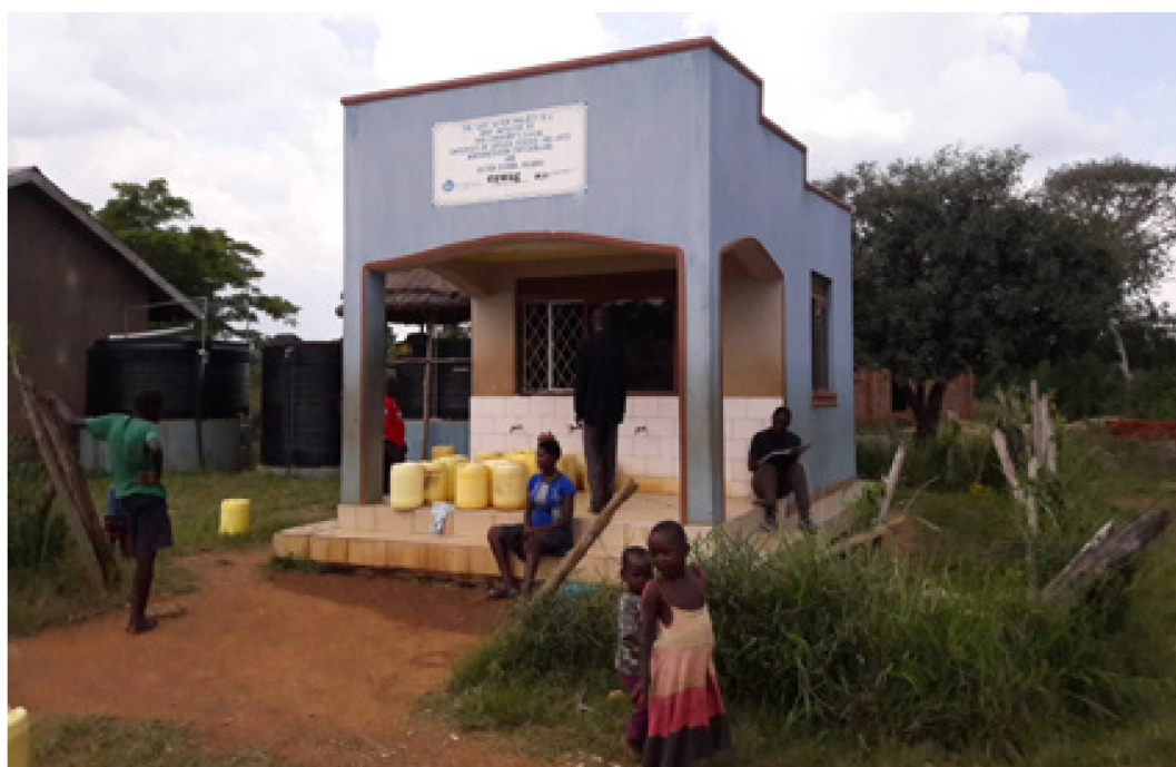
Fig. 2: Kiosque de Busime (Ouganda). À gauche les réservoirs où l'eau est traitée.