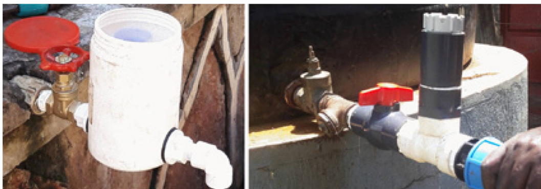
Fig. 3 : Deux doseurs de chlore automatiques fabriqués à partir de matériaux locaux et bon marché.

C'est pourquoi, en parallèle de la filtration membranaire, un post-traitement au chlore est nécessaire. De plus, la concentration chimique résiduelle de ce procédé désinfecte les jerrycans des ruraux qui sont souvent contaminés par de la matière fécale. Or, les doseurs de chlore disponibles dans le commerce sont coûteux, rares, voire impossible à réparer en cas de problème technique. Dans le cadre de ce projet, des doseurs de chlore ont été construits à partir de matériaux bon marché et locaux (fig. 3). Les prototypes ont démontré leur performance en fournissant une dose stable de 1,5 à 2,5 mg Cl/L dans 78 % des cas, tout en ne coûtant que 15 % des revenus totaux générés par la vente d'eau.