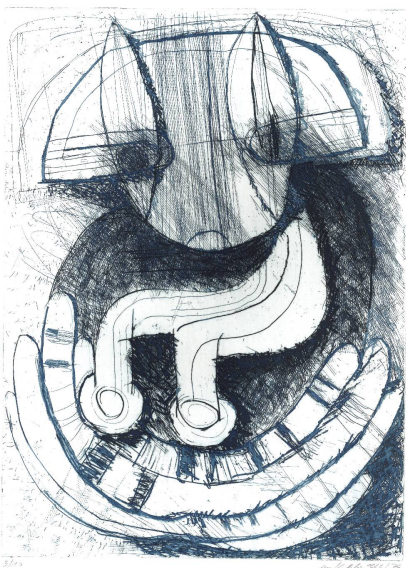
Max Kohler, Chat à 8 queues — Époque apocalyptique , 1966, eau-forte, 30 × 22 cm, coll. musée jurassien des Arts, Moutier.

Christine Salvadé, « Arthur Jobin, architecte de la couleur », in : Actes de la S.J.É. , vol. 99, 1996, p.73-75.