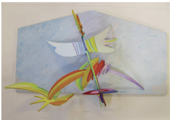
René Myrha, Créature spatiale III , 1992, maquette pour un objet, Centre administratif U.B.S., Genève, acrylique sur carton plume, 29 × 47 × 15,5 cm, coll. musée jurassien des Arts, Moutier.

Avec Créature spatiale III , René Myrha suggère un ailleurs sous le signe de l'envol fantasmagorique et onirique. Son relief dialogue avec la fable de Rose-Marie Pagnard. Le verbe se glisse en filigrane dans cette créature spatiale , lui conférant une nouvelle dimension dramaturgique :