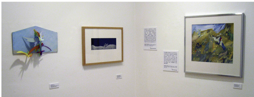
Exposition les Éditions et les Arts , salle 1, avec des œuvres de: René Myrha, Charles-François Duplain, Rose-Marie Zuber.