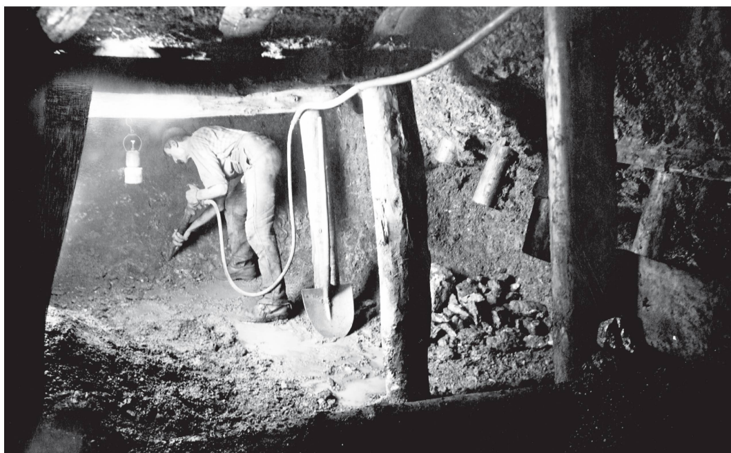
Illustration 5 : Mines de Delémont, années 1920

Les wagonneurs, ils arrivent à fond la caisse. Tirez-vous entre deux stolls pour vous abriter de ces voyous. Lampe accrochée à l'avant, arc-boutés à l'arrière, ils profitent de toutes les descentes pour se donner de l'élan et pousser le moins possible. Mais les casse-cou ne manquent pas d'adresse et ils ont un frein qu'ils savent utiliser si nécessaire.