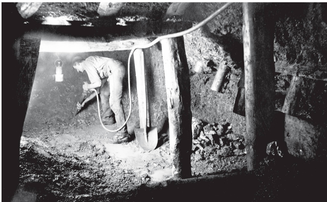
Illustration 5 : Mines de Delémont, années 1920

Les wagonneurs, ils arrivent à fond la caisse. Tirez-vous entre deux stolls pour vous abriter de ces voyous. Lampe accrochée à l'avant, arc-boutés à l'arrière, ils profitent de toutes les descentes pour se donner de l'élan et pousser le moins possible. Mais les casse-cou ne manquent pas d'adresse et ils ont un frein qu'ils savent utiliser si nécessaire.