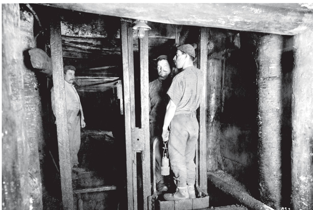
Illustration 4 : Mines de Delémont, années 1920 ©musée jurassien d'Art et d'Histoire, Delémont.

C'est la maison Wyss, charpente, rue du Stand à Delémont, qui fut chargée de construire le chevalement et les supports intermédiaires sur une distance que je n'ai pas connue, mais qui devait tourner autour de 1 000 m de longueur. On accola le chevalement à l'ancien lavoir. Je pense qu'on utilisa l'ancien appareil, un broyeur qui libère le minerai de sa gangue d'argile rouge. Il sera conduit par wagonnets sur la passerelle enjambant la Sorne, versé ensuite dans un wagon C.F.F. stationné à cet effet au terminus d'une ligne terminée par un poids public à la rue de Chaux. Le Schlamm (limon) sera évacué périodiquement dans la Sorne qui prendra alors la couleur orange du bolus. Le minerai partira à destination du haut-fourneau de Choindez.