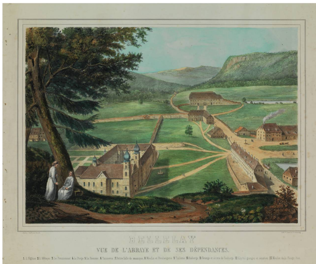
Fig. 2 : Vue de l'abbaye de Bellelay et de ses dépendances à la fin du XVIII e siècle. Lithographie d'E. Simon, Strasbourg, d'après Jules Juillerat (AAEB, FK Portefeuille 64).

Si la relative austérité des façades correspond à celle que relève Philippe Bonnet 35 pour les établissements prémontrés de France, les quatre pavillons d'angle donnent une réelle dynamique à l'architecture du complexe de Bellelay. Ils font saillie par rapport aux façades: leur avancement est de treize pieds dans le projet de Monnot (plus de quatre mètres), mesure correspondant exactement à celle qu'enregistrera septante ans plus tard le notaire estimateur Gassmann. Ils sont aussi plus élevés, avec leur double rangée de fenêtres superposées que l'on aperçoit sur le dessin de Büchel. Le couvent compte un rez-de-chaussée et deux étages solidement assis sur des caves dont les arcades figurent déjà dans l'ébauche de Monnot.