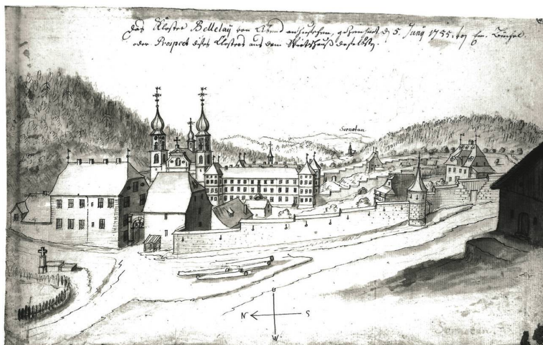
Fig. 1: Le couvent de Bellelay, par Emmanuel Büchel, en 1755 (Kunstmuseum Basel, Cabinet des estampes, Inv. 1886.7.3, fol 45, Skb. A 48b).