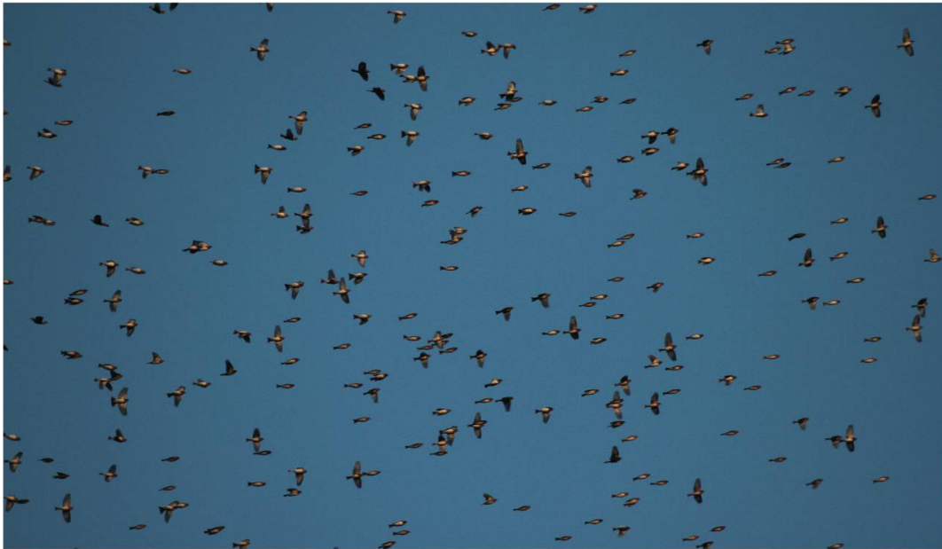
Fig. 10 et 11: Vol de retour (14.01.12)

palombes, Accipiter gentilis , du milan royal, Milvus milvus , et de la buse variable, Buteo buteo . Les nombreuses attaques tentées et parfois réussies sur les vols de pinsons provoquent des changements brusques de direction, des éclatements et des contractions, qui engendrent de spectaculaires chorégraphies aériennes. Ces resserrements et étalements successifs constituent une tactique pour déconcerter l'ennemi, tactique qu'utilisent aussi les bancs de poissons.