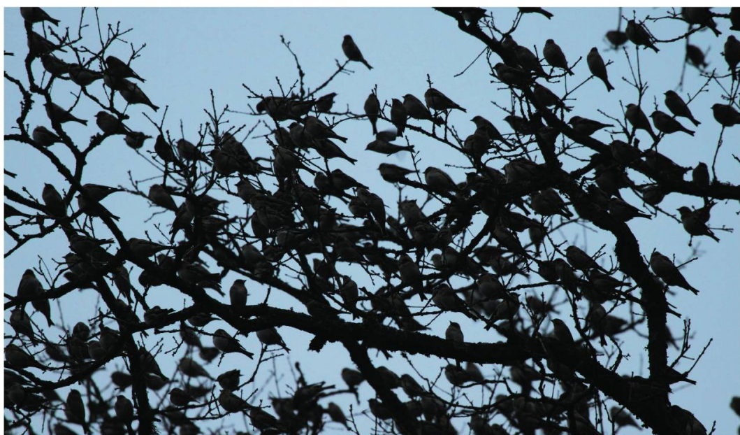
Fig. 12 et 13: Pinsons du Nord sur les arbres de la lisière (10.01.12)