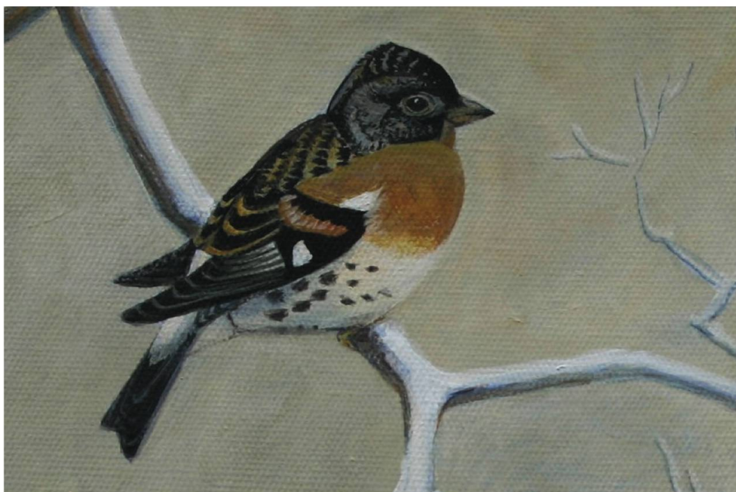
Fig. 1 : Pinson du Nord mâle au début de l'hiver (peinture Gicé, 2012)

Après le merveilleux spectacle que les pinsons du Nord avaient offert durant l'hiver 2001-2002 à Fontenais 1 , plus d'un million de ces passe-reaux ont séjourné à Vendlincourt au début de l'hiver 2011-2012. Voisin immédiat du site de repos nocturne, l'auteur a suivi ce séjour jurassien de près d'un mois.