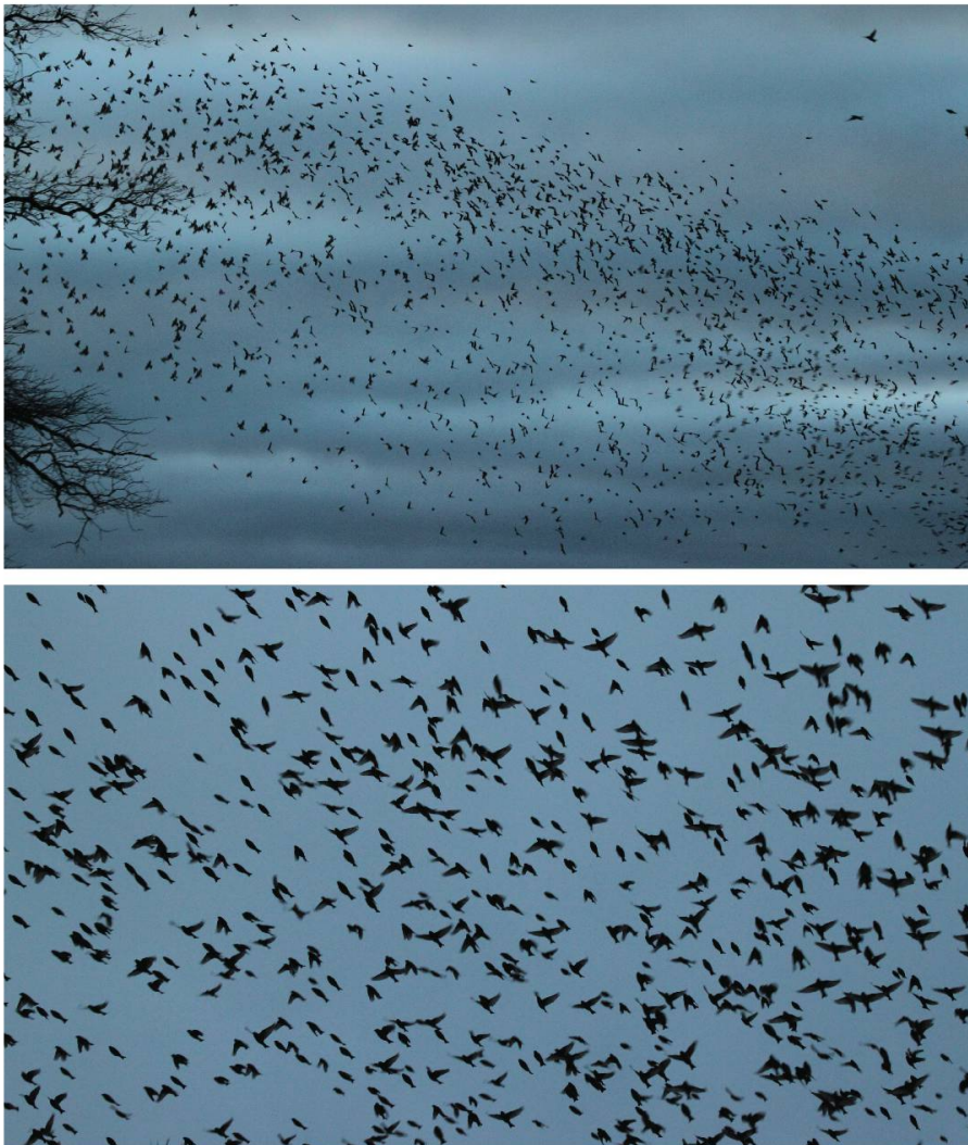
Fig. 8 et 9: Ballet aérien (3.01.12)

Comme lors d'autres invasions de pinsons du Nord, la présence des prédateurs était visible dès l'installation du dortoir, en particulier du faucon pèlerin, Falco peregrinus , de l'épervier d'Europe, Accipiter nisus (jusqu'à trois individus présents simultanément), de l'autour des