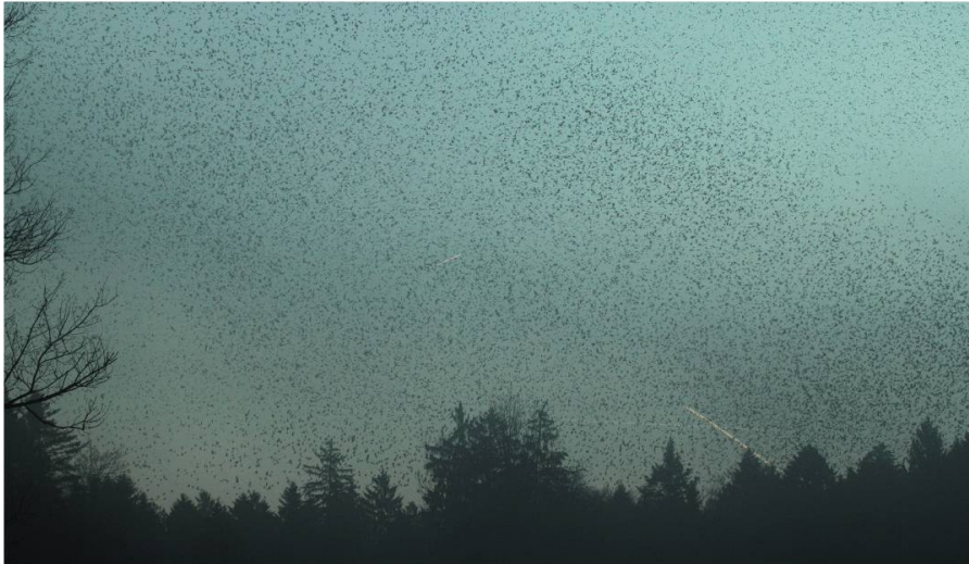
Fig. 5: Départ matinal (11.01.12)