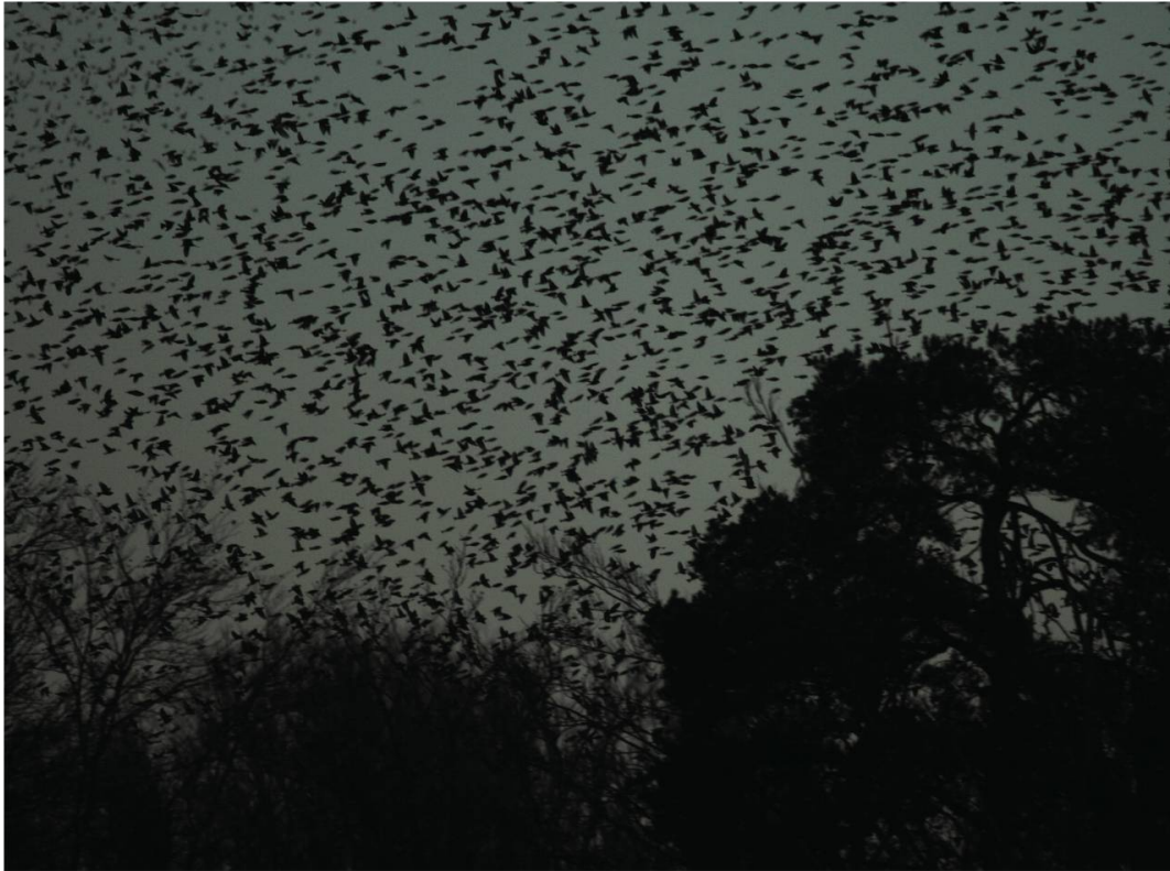
Fig. 14: Nuit tombante, dernier envol vers le gîte nocturne (03.01.12)