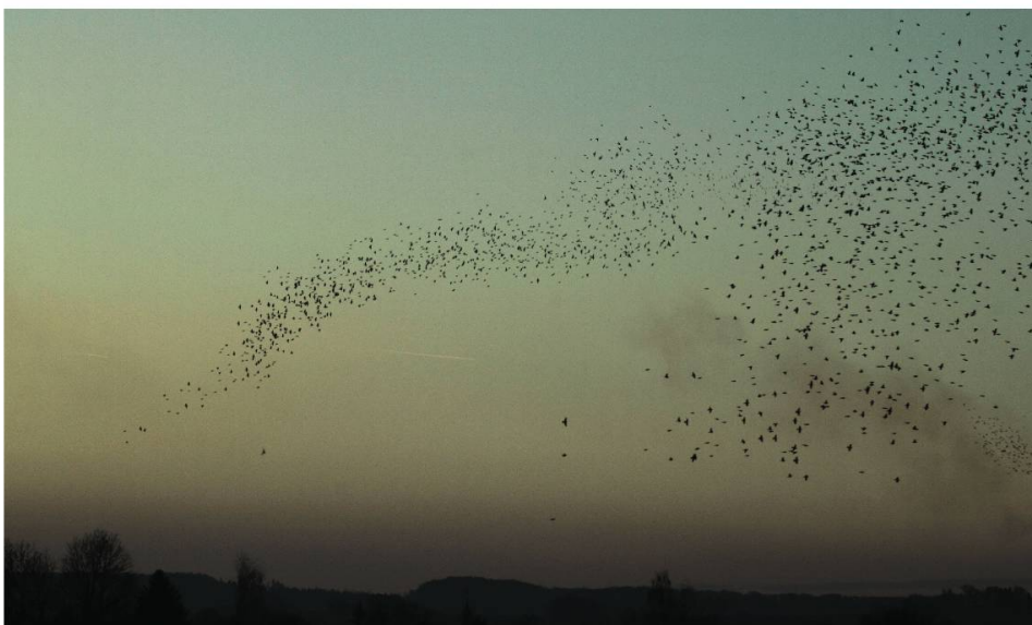
Fig. 3 et 4: Le soir, vols au-dessus de Vendlincourt (10.01.12)