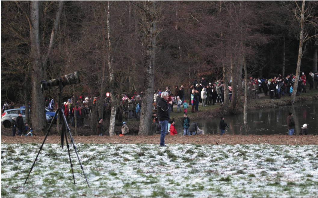
Fig. 15: La foule des observateurs du dimanche (15.01.12)