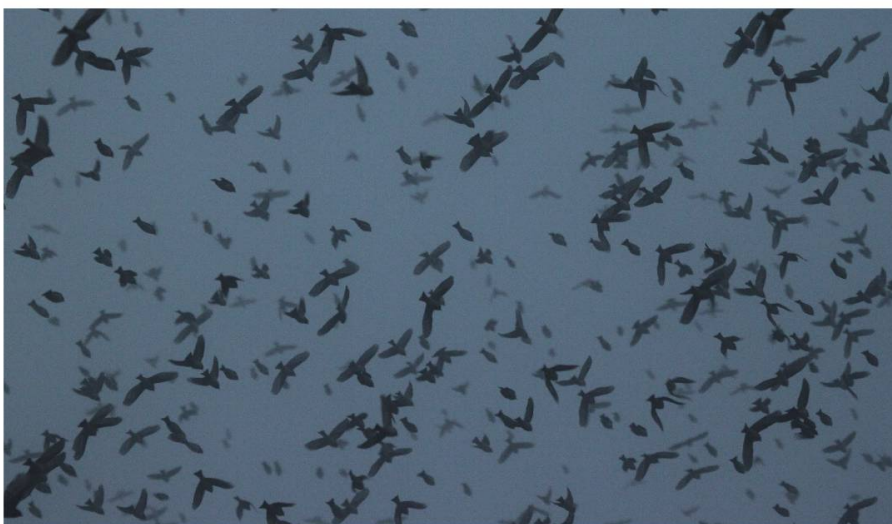
Fig. 6 et 7: Retour féérique dans la brume (11.01.12)