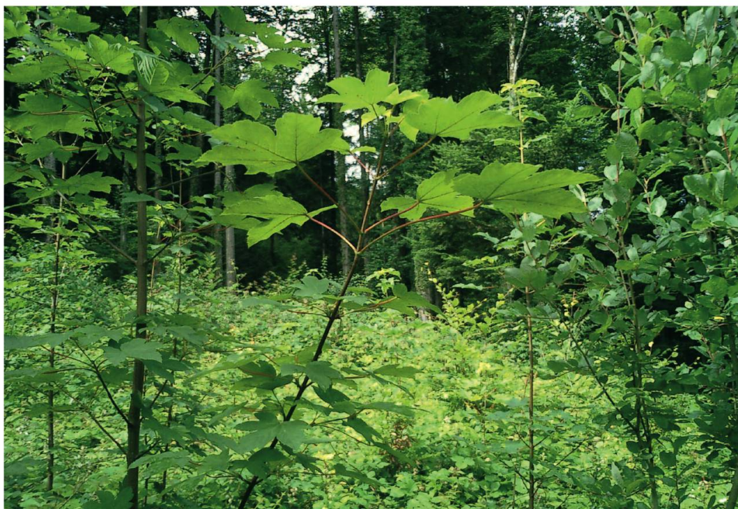
Ill. 2. Surface de jeune forêt issue d'un rajeunissement naturel. Les soins aux jeunes forêts sont primordiaux pour conserver la diversité et assurer la qualité future du bois.