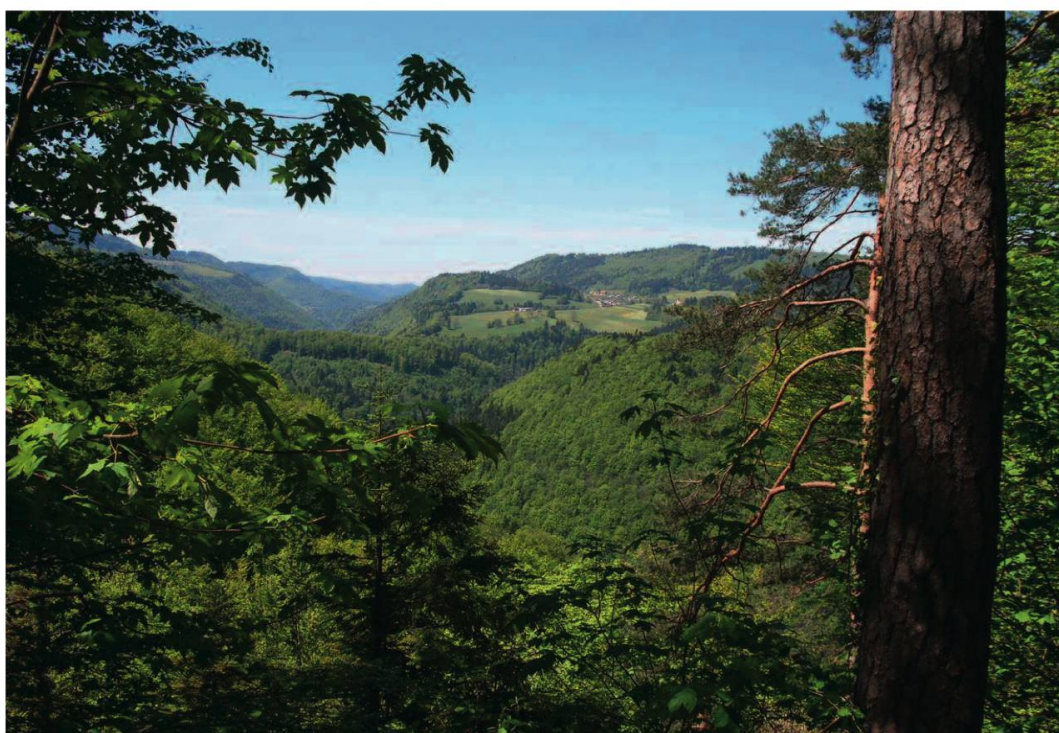
Ill. 1. L'omniprésente forêt jurassienne dans la vallée du Doubs. Vue en direction d'Epaouvillers (Photo de l'auteur).

Avec plus de trente-sept mille hectares 1 de forêts et de pâturages boisés, correspondant à un taux de boisement de plus de 44 %, le Jura est le deuxième canton suisse le plus boisé après le Tessin (ill. 1). La forêt jurassienne comprend 53 % d'essences feuillues, tendance en augmentation. Elle est dominée par le hêtre, le sapin et l'épicéa, qui constituent ensemble 80 % du volume de bois sur pied. Un hectare contient en moyenne 356 m 3 de bois 1 , un volume sur pied particulièrement élevé en moyenne européenne. La diminution également perceptible dans le paysage des résineux correspond à une évolution naturelle. Elle reflète l'effort entrepris par les propriétaires en vue de favoriser les essences feuillues. Elle démontre surtout la primauté et l'importance centrale du résineux pour le marché du