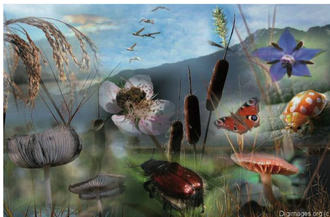
Fig. 5. Garder l'espoir devant tant de beauté !

pour les parcs, les jardins et les gazons, lutter contre les plantes invasives, mettre à disposition des espaces de loisirs, de jeu et de détente, créer des sentiers à thèmes... Un riche programme pour les dix ans à venir.