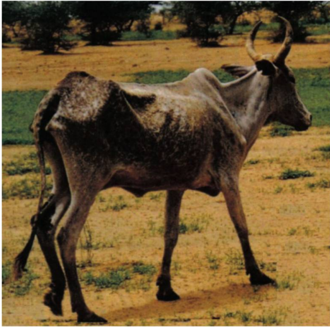
Fig. 4. ... vaches maigres pour les autres.

Mais, comme pour faire contrepoint à cette réalité pessimiste, la diversité du vivant n'a de loin pas encore révélé toute sa richesse. Et cependant, par la modification ou la destruction d'écosystèmes, nous anéantissons par milliers des espèces, hélas même pas répertoriées. Pourtant toutes sont insérées dans un équilibre naturel qui a mis des millions d'années à s'établir. Rappelons-nous que ce sont les petits cailloux qui calent les grosses pierres de l'édifice, il en va de même des équilibres naturels.