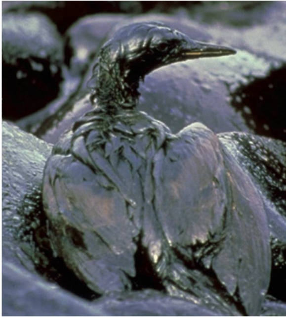
Fig. 2. Oiseau de mer pris par la marée noire du golfe du Mexique.