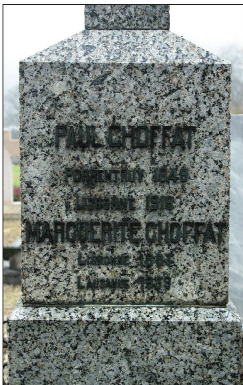
Fig. 3. Inscription sur la tombe de Paul Choffat (socle de la croix).