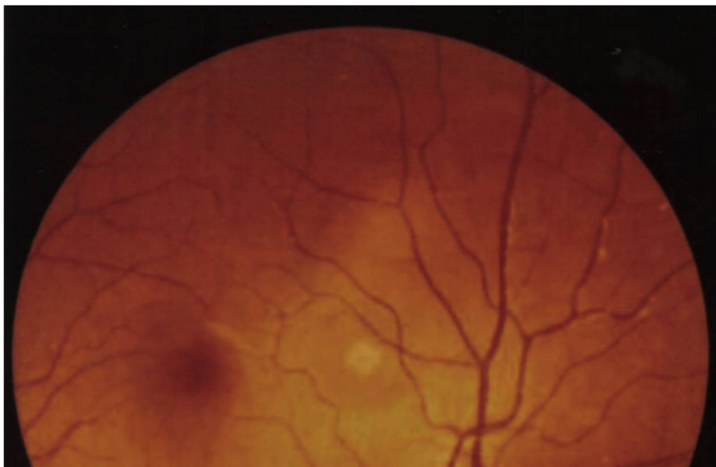
Fig. 3. Œuvre imprimée d'Auguste Quiquerez entre 1835 et 1882. Représentation graphique de cette production par année et en nombre de pages.

légion; ses recherches archéologiques, géologiques, historiques, agronomiques, sur les coutumes et traditions populaires, sur le patrimoine bâti, etc. foisonnent elles aussi. Cet essor de la passion de savoir, de découvrir, s'exprime en toute logique à travers une vaste production d'imprimés, amorcée dès 1851, qui ne s'arrêtera plus jusqu'à la mort d'Auguste Quiquerez, le 16 juillet 1882. Elle va même au-delà, puisque vingt-deux notices sont encore répertoriées pour les années 1889 à 2003.