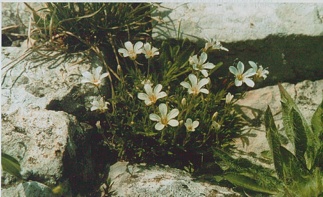
Figure 2: Arenaria Grandiflora, «Corbeille 2», corolles bien ouvertes. Chasseral, 17.06.2002.