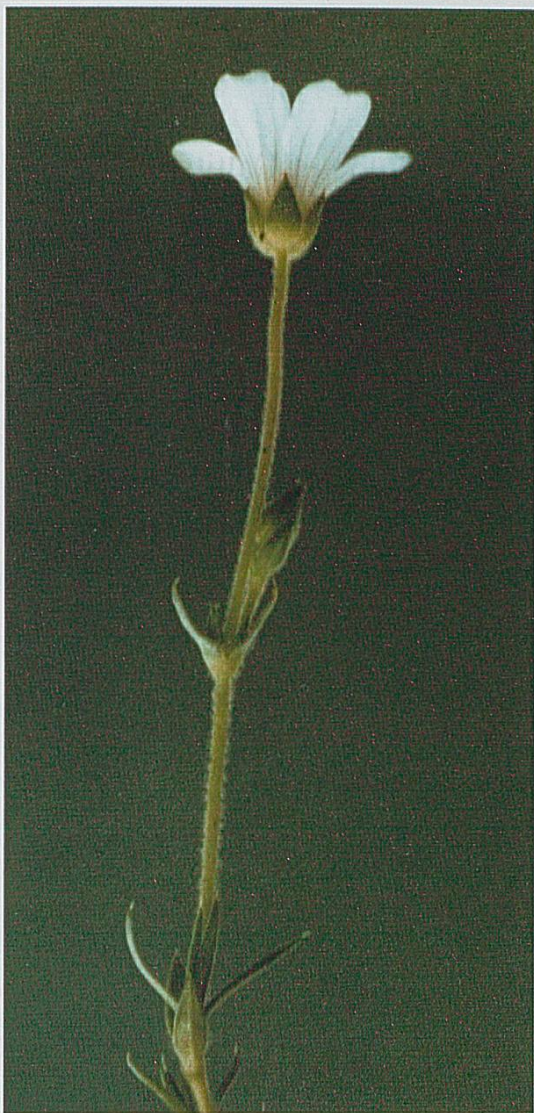
Figure 1: Arenaria Grandiflora , tige florale. Chasseral, 8.6.2002.