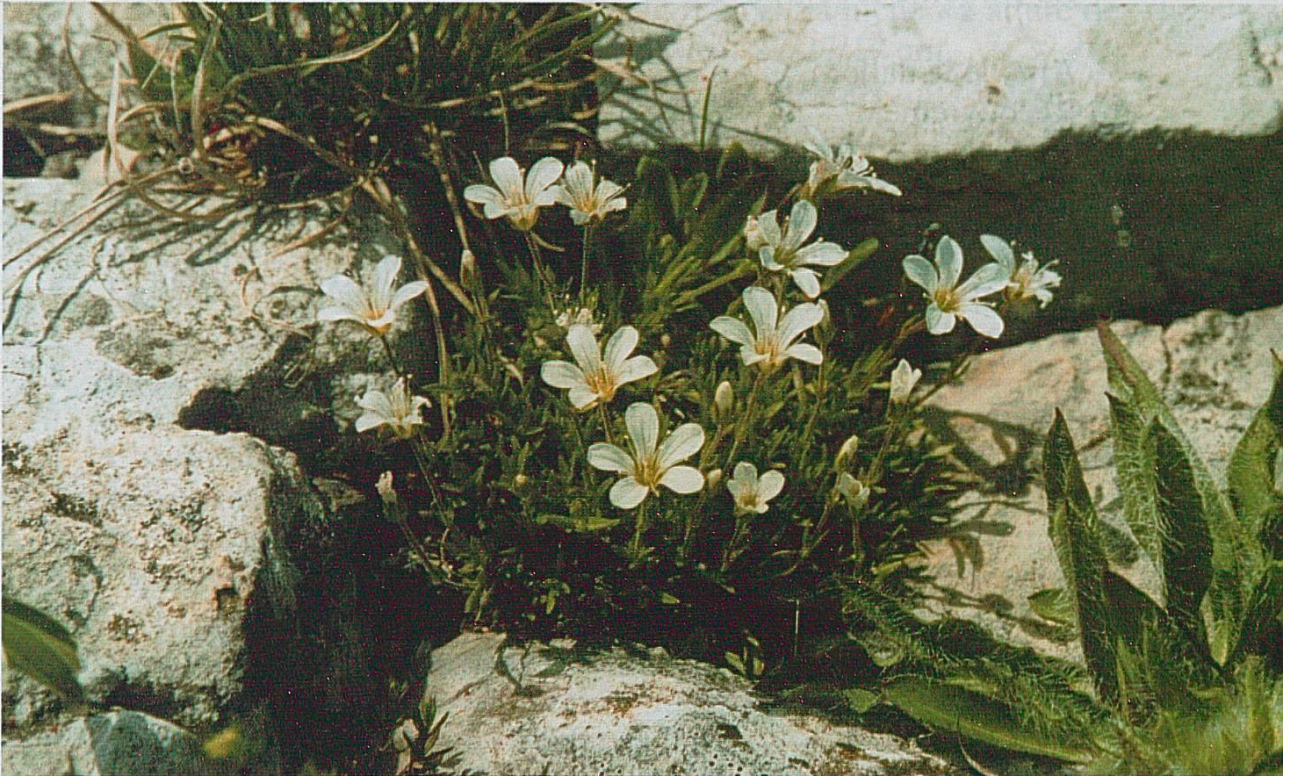
Figure 2: Arenaria Grandiflora, «Corbeille 2», corolles bien ouvertes. Chasseral, 17.06.2002.