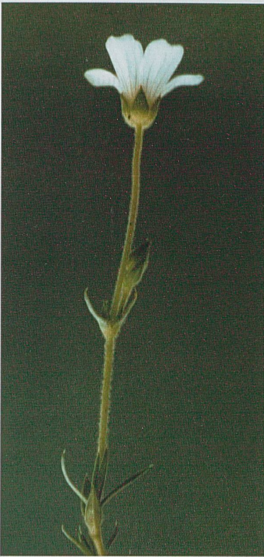
Figure 1 : Arenaria Grandiflora , tige florale. Chasseral, 8.6.2002.