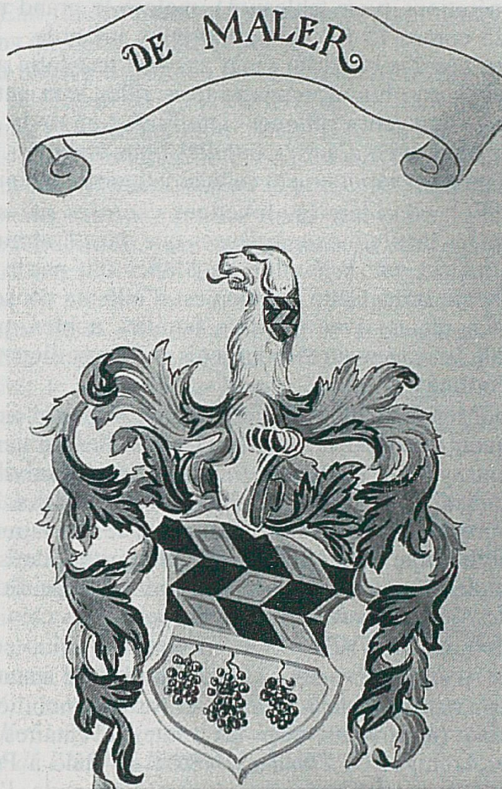
Armorial Folle tête.

Cet écusson est celui de Jean Germain de Maller dont le sceau est apposé sur l'enveloppe d'une lettre adressée au prince-évêque de Bâle le 30 avril 1757 (voir aux AAEB, le dossier des brevets N° 11, section B 137).