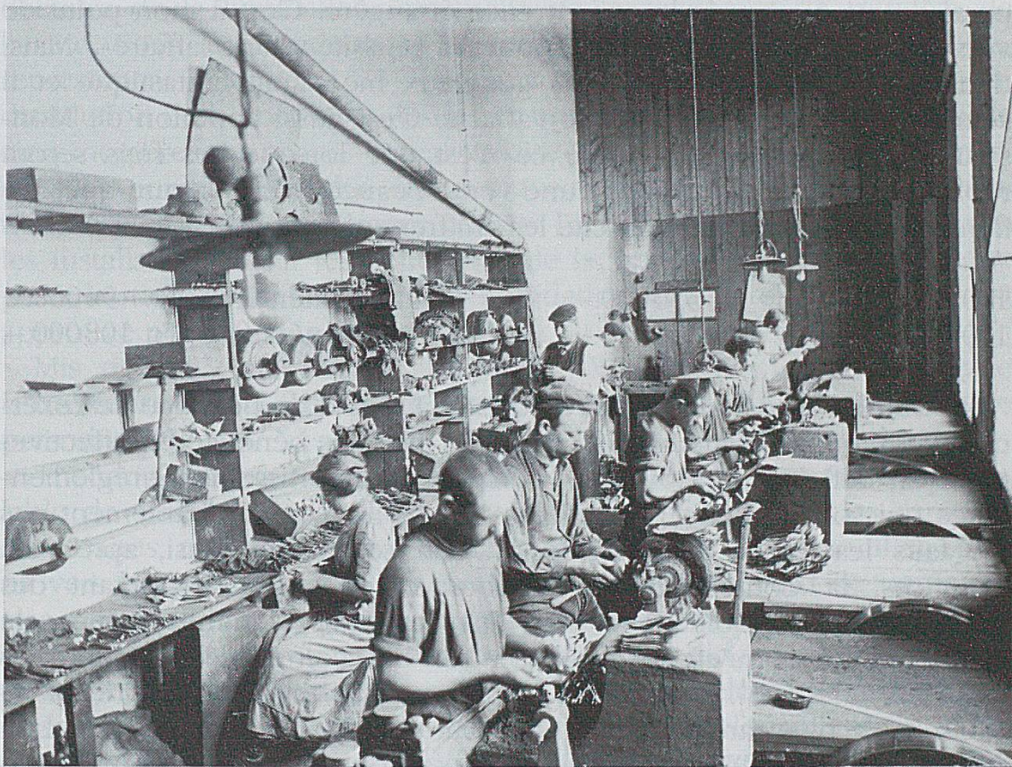
L'atelier de polissage des cuillers.

La société était devenue la Fabrique suisse de coutellerie et services (Schweizer Besteckfabrik) 19 . L'assemblée générale des actionnaires du 22 décembre 1900 avait fixé le capital social à 262500 francs, réparti entre 400 actions à 281 fr. 25 et 400 à 375 fr. Theodor Wenger dirigeait la fabrique, qui occupait plus de 150 ouvriers en 1902.