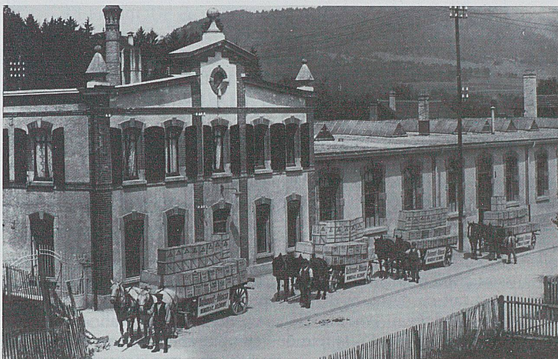
La coutellerie de Delémont: un chargement à destination d'Odessa prêt au départ, vers 1919.

Tandis que l'industrie sidérurgique, restructurée en 1883 sous l'égide de la société Louis de Roll S.A., trouvait un nouveau souffle, une quinzaine de fabriques et d'ateliers d'horlogerie s'étaient implantés à Delémont, Bassecourt, Courtételle et Develier, donnant naissance à un mouvement ouvrier embryonnaire 7 . Outre la fabrique de pâte de bois de Bellerive, fondée en 1867, des entreprises d'autres branches avaient vu le jour depuis la construction des chemins de fer, notamment deux grands ateliers de construction de machines, de serrurerie et de chaudronnerie, chacun occupant une trentaine d'ouvriers, ainsi que l'imprimerie Boéchat qui publiait Le Démocrate depuis 1877, la petite fabrique de meubles Justin Kohler et la brasserie Albert Gütler en 1884. De plus, en 1889, des comptoirs de Delémont, Courroux et Mervelier dépendaient quelque 180 personnes, des femmes pour la plupart, qui filaient et tissaient la soie à domicile pour une maison zurichoise 8 .