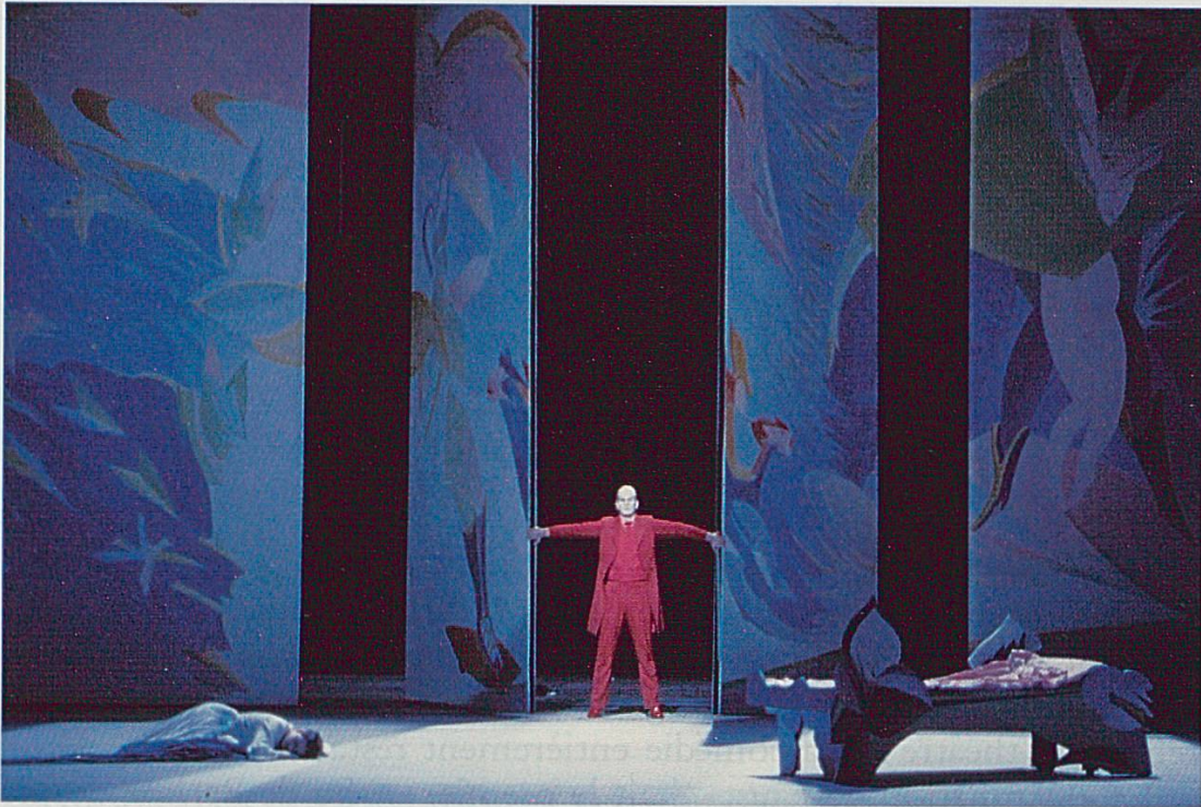
Acte III, scène 3.