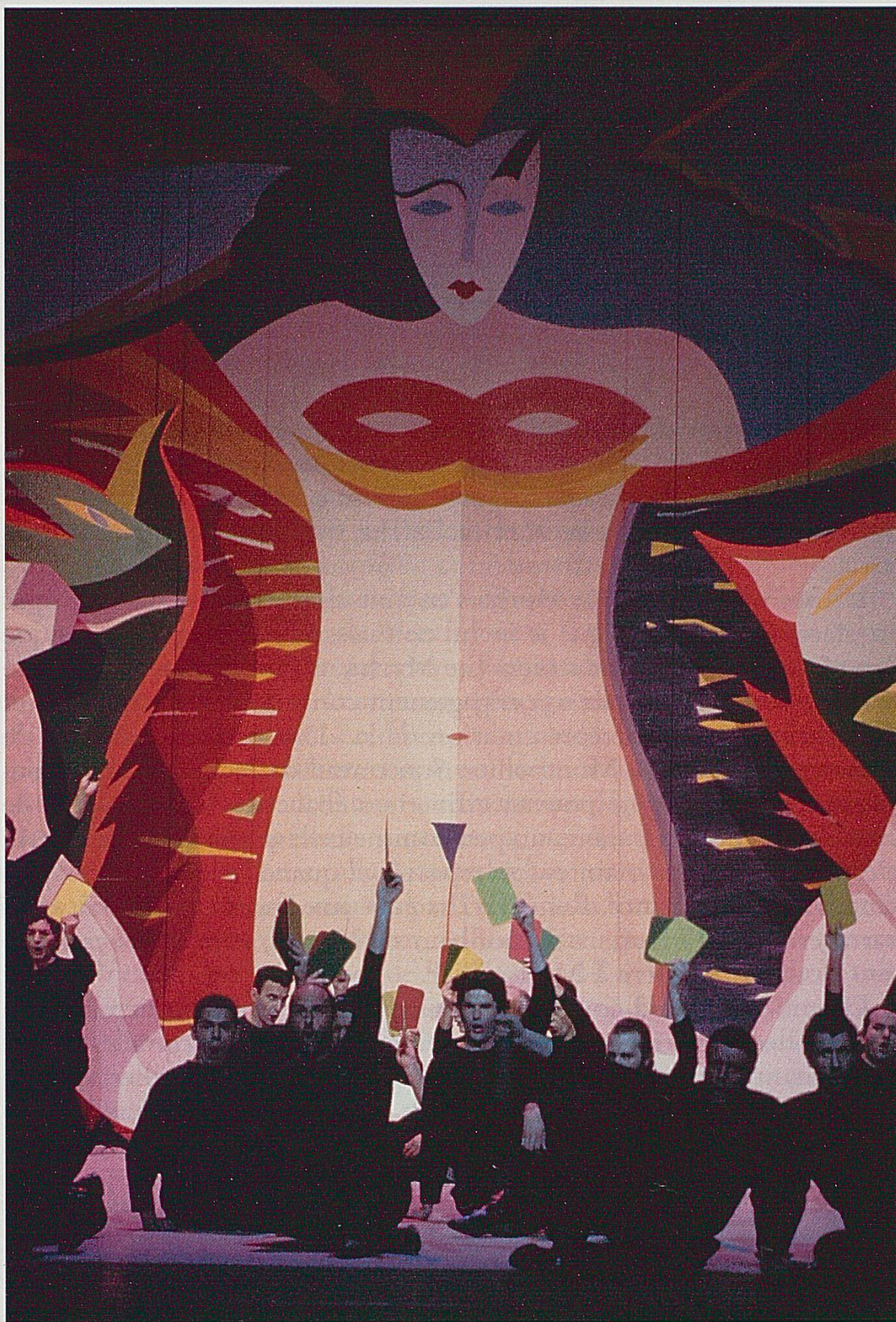
La Damnation de Faust d'H. Berlioz. Opéra de Montpellier. Acte II, scène 2.