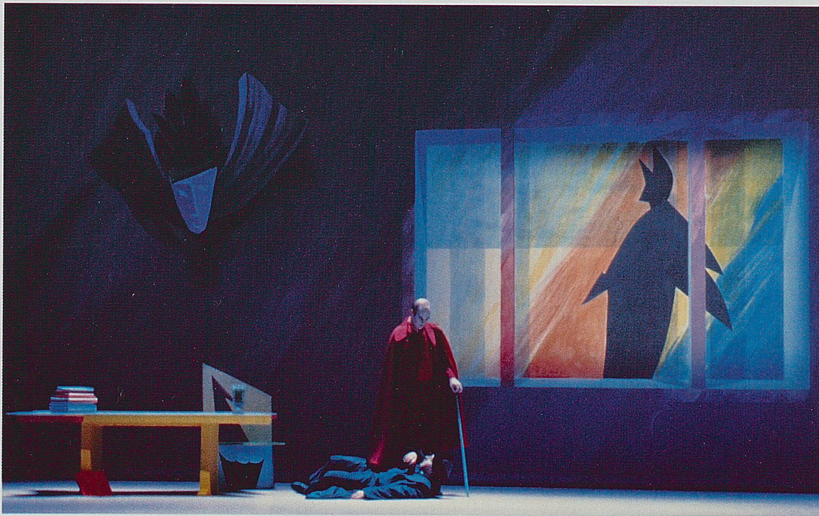
Acte II, scène 1.