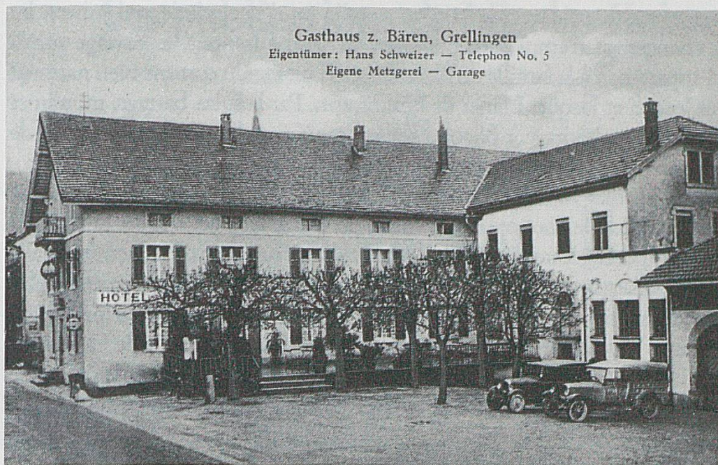
Hôtel de l'Ours à Grellingue (carte postale datée de 1933).