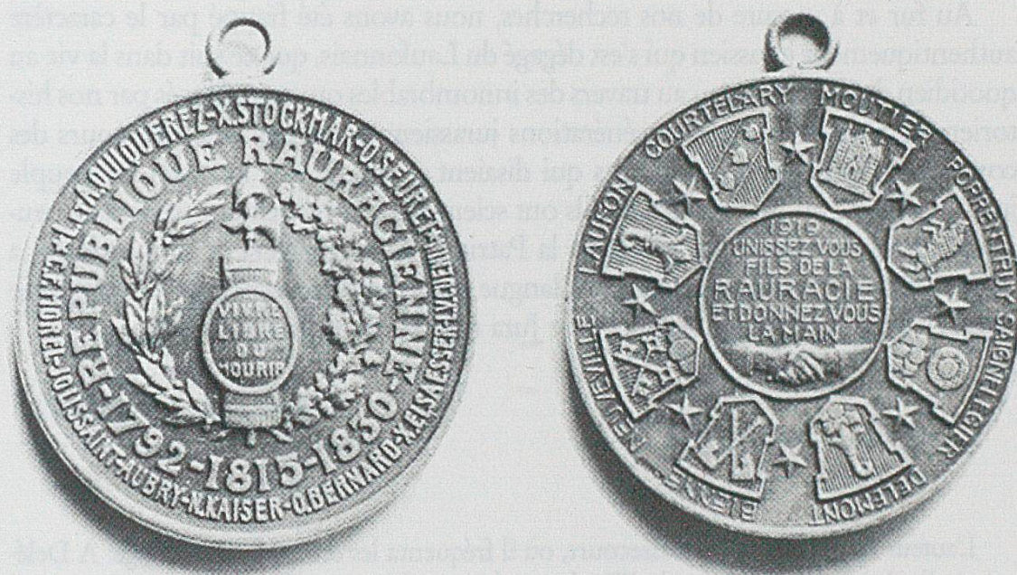
Médaille de bronze frappée en 1919.