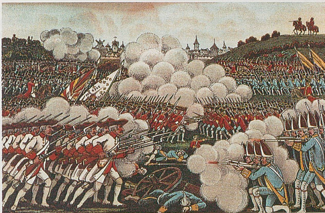
Le régiment d'Eptingen à la bataille de Corbach, le 10 juillet 1760. Il se trouve au centre et se reconnaît grâce aux tuniques rouges de son uniforme et à la double bannière typique dans les régiments suisses au service étranger (Casimir Folletête, Le régiment de l'évêque de Bâle au service de France ).