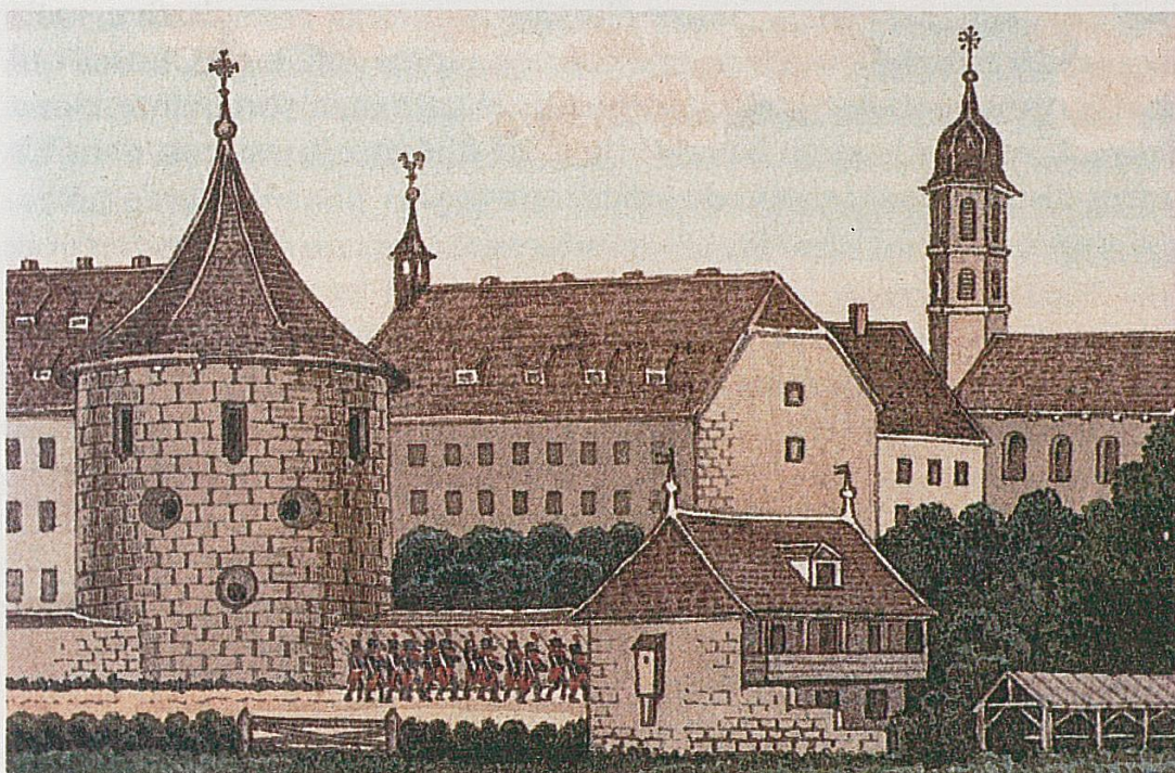
Porrentruy à l'époque de l'occupation française. Il s'agit d'une des vignettes que l'on trouve dans le recensement de 1803 (Musée de Porrentruy).