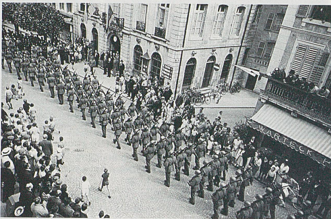
Le 18 novembre 1939, la brigade frontière 3 défile à Porrentruy devant le général Guisan, un moyen comme un autre de faire oublier que le «saillant» n'est pas défendu...

Porrentruy possède d'autres cantonnements. Le vingt-deux, nous cédon les combles; le vingt-neuf, les salles de chant et de dessin. Le deux octobre au matin, il n'est plus question de tenir classe: nos corridors sont encombrés de soldats.