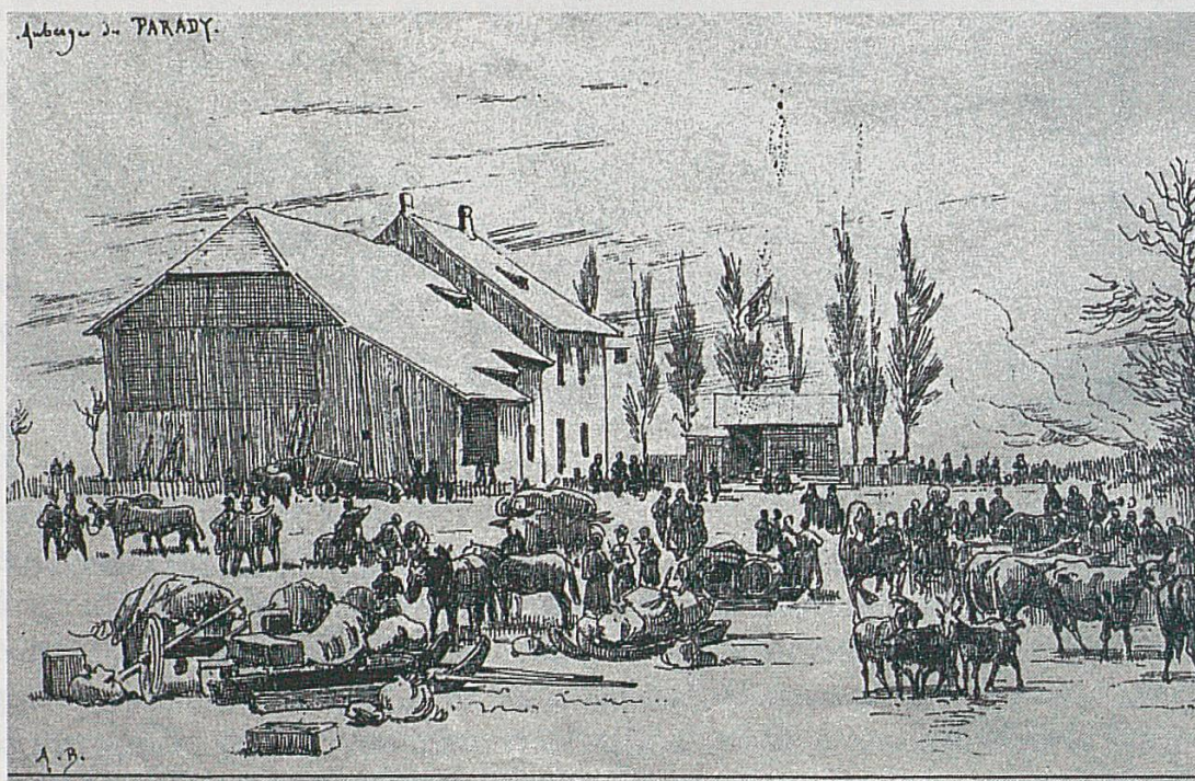
L'auberge du Paradis, près de Bure, en janvier 1871. Afflux de réfugiés venus de Croix et d'Abbévillers (Auguste Bachelin).

Aux Franches-Montagnes, le préfet Borruat (1870-1872) se signale par son anticléricalisme et sa participation active aux « persécutions ». Son successeur, Froidevaux (soulignons que ces deux fonctionnaires portent des noms jurassiens), joue un rôle déterminant dans la décision d'occuper Saignelégier, puisque c'est lui qui en fait la demande ! Pratiquement tous les préfets des districts catholiques se montrent des représentants très dévoués des autorités cantonales, ce qui s'explique facilement. Lorsqu'une préfecture est à repourvoir, la population locale exprime ses vœux par une élection purement consultative, mais le candidat désigné trouve rarement grâce auprès du Grand Conseil qui choisit presque toujours des hommes de la tendance dominante, donc des radicaux 21 . Il y aurait lieu de voir si les libéraux jurassiens, dans les autres districts, ont inspiré de telles mesures.