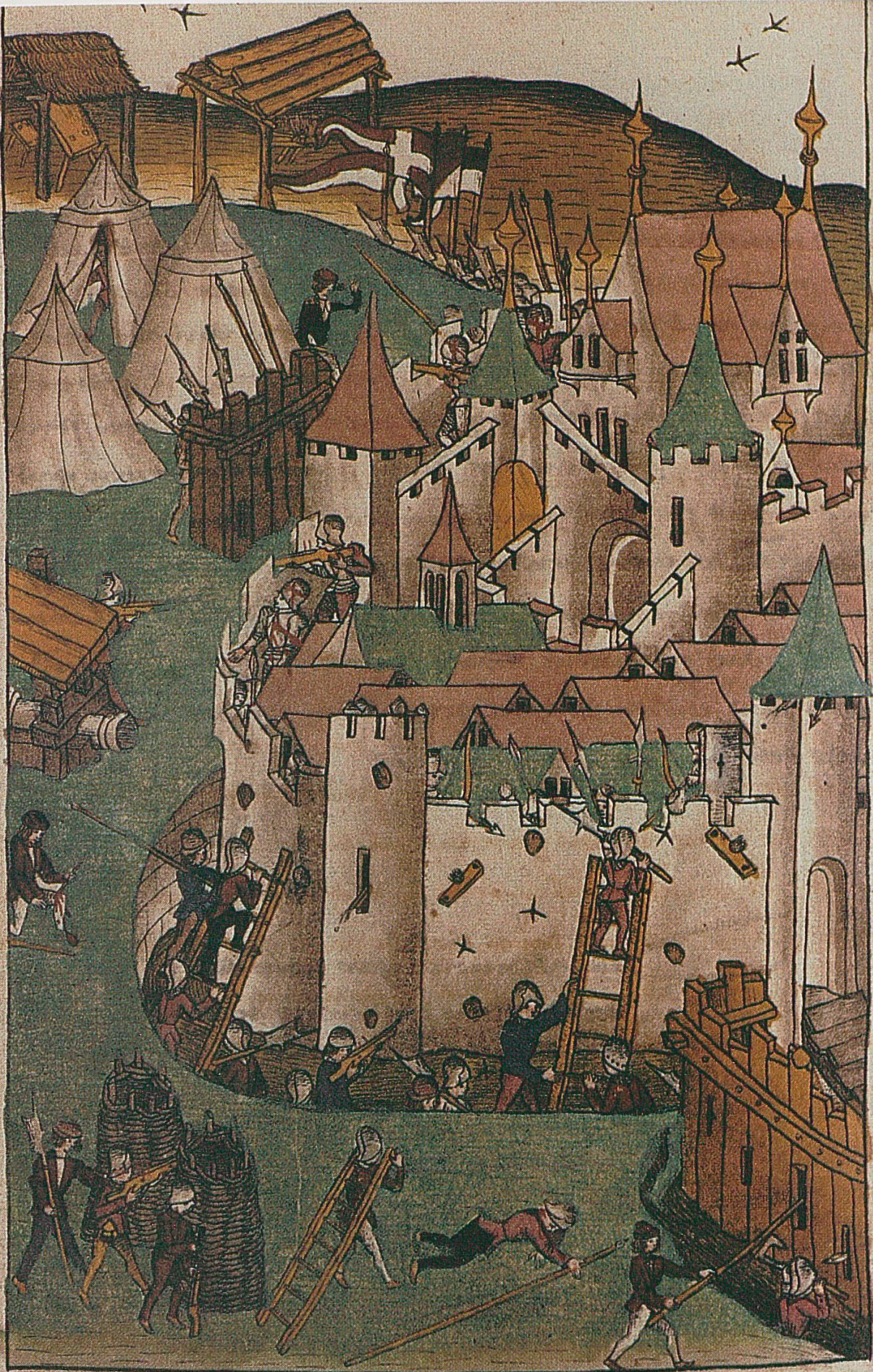
Strasburg / fallenden und an dem gewanten / und