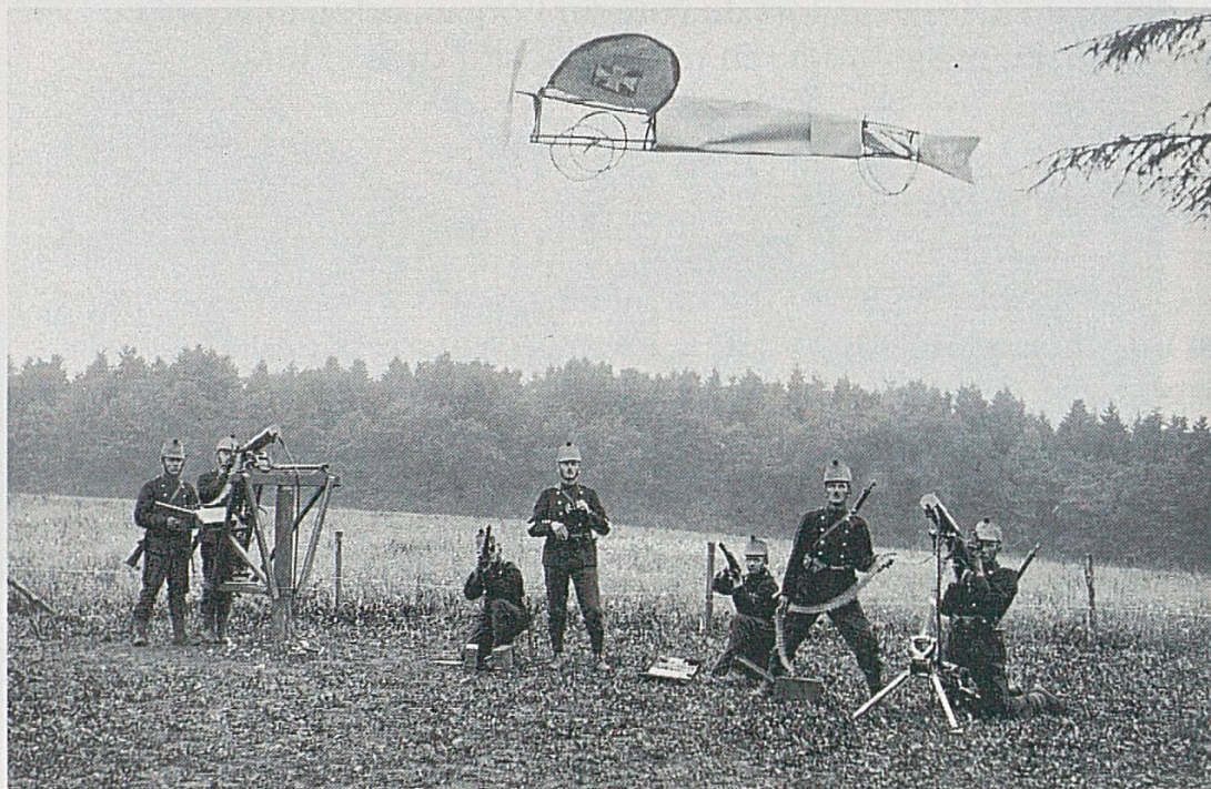
Pendant la Première Guerre mondiale, des soldats suisses s'entraînent au tir DCA, «quelque part en Ajoie». Une sorte de cerf-volant simulant un avion leur sert de cible.

On aimerait également savoir pourquoi les autorités militaires décident de retirer les cartouches, à un moment donné, aux troupes qui gardent la frontière du saillant de Porrentruy. La présentation des accords d'état-major entre Berne et Paris qui prévoient d'importants mouvements de troupes dans les sept districts, en cas d'invasion de la Suisse par l'Allemagne, remplacerait avantageusement la commémoration du caporal Peugeot, le premier mort de la guerre, et l'épisode des uhlans capturés par le landsturm helvétique, en août 1914. La vision du fossé reste trop influencée par les sources passionnées de l'époque. La soixantaine de lignes consacrées à la Deuxième Guerre mondiale ne permettent pas de rappeler les aspects des accords militaires avec la France, du moins ceux qui auraient pu concerner nos régions. Une étude reste à faire sur l'activité des services de renseignement dans le Jura, avant que la légende ne cache trop la vérité. Il semble que les chefs