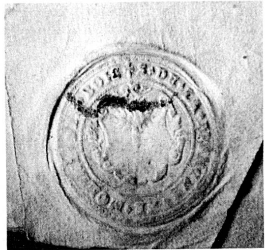
Fig. 1 Sceau de la Franche Montagne des Bois, 1615.