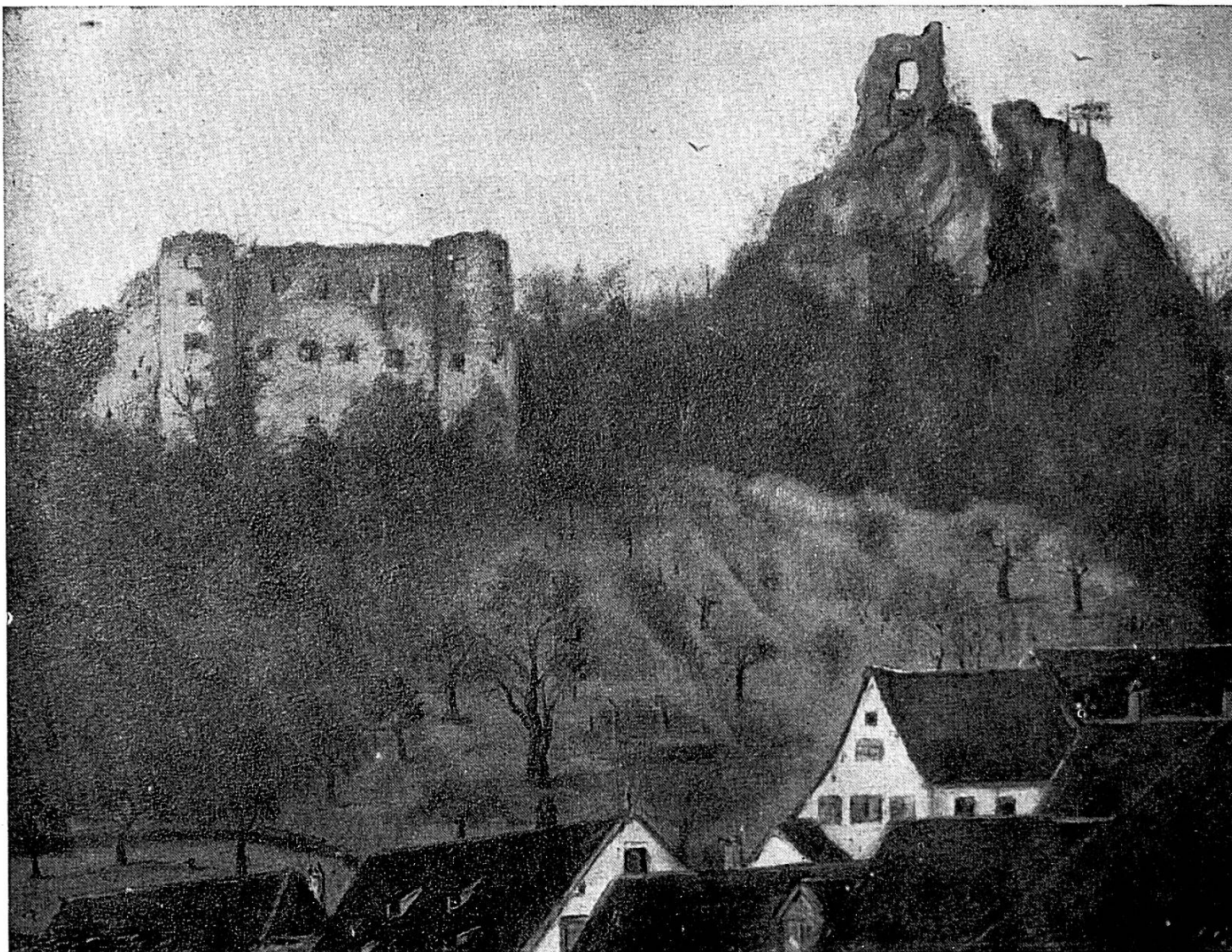
Le château de Ferrette après 1789