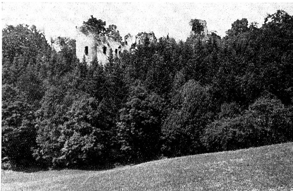
Les ruines du château de Morimont

Le château de Morimont, dont les ruines dominent un contrefort de la chaîne du Jura, à peu de distance de la frontière de l'Ajoie, entre Lucelle et Levoncourt, est l'objet d'un acte de vente et d'inféodation