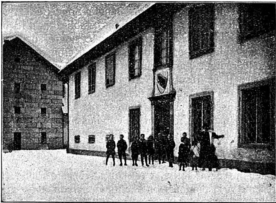
Cour de la Préfecture de Courtelary