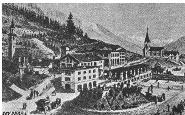
Fig. 2 Die im Jahre 1881 errichtete Bogenlampe vor dem Kulm-Hotel

Zu Beginn des 20. Jahrhunderts wurden zwischen der «AG» und der Gemeinde Silvaplana Verhandlungen aufgenommen,