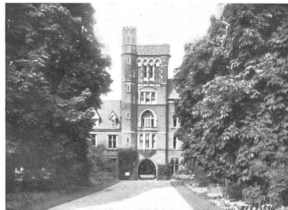
Fig. 1 Girton College in Cambridge

Das Bankett in der Guildhall liess an Feierlichkeit nichts zu wünschen übrig. Bekanntlich ist dieses ehrwürdige, aus dem Anfang des 15. Jahrhunderts stammende Gebäude im Jahre 1940 durch Bomben und Feuer stark beschädigt worden. Schon im Jahre 1666 ist sein Dach einem Schadenfeuer zum Opfer gefallen und erst im Jahre 1954 ist das