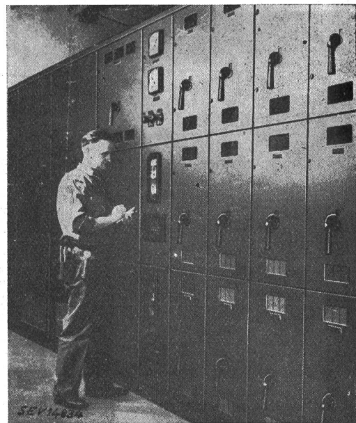
Fig. 10 Verteilanlage für Innenraum, aus vorgefertigten Schalteinheiten zusammengesetzt

Die gleiche Vereinfachungstendenz hat sich auch im Ausbau der Innenanlagen durchgesetzt. Hiefür stehen ebenfalls die fertig vorgefertigten Einheits-schaltkästen zur Verfügung, die je nach Erfordernis zusammengesetzt werden können. Wie Fig. 10 zeigt, ergibt sich dadurch eine einfache Montage und gute Erweiterungsmöglichkeit. In den ganzfeldrigen Kasten links befinden sich der Transformator und die Hochspannungsapparate, dann folgen das Sekundärmeßfeld mit Amperemetern und