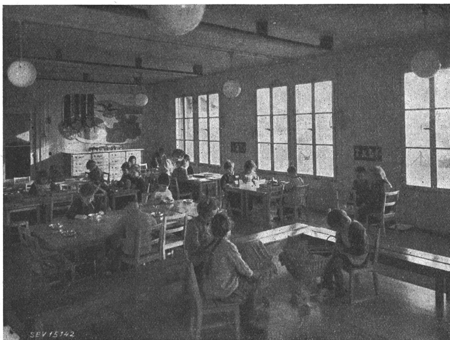
Fig. 1 Schulstube des Kindergartens in Riehen (BS) An der Decke sichtbar drei der insgesamt vier Strahlungsheizkörper

Anschlusswert. In diesem Falle beträgt die Heizleistung 1,25 kW, entsprechend einem spezifischen Wert von 43 W/m 3 .