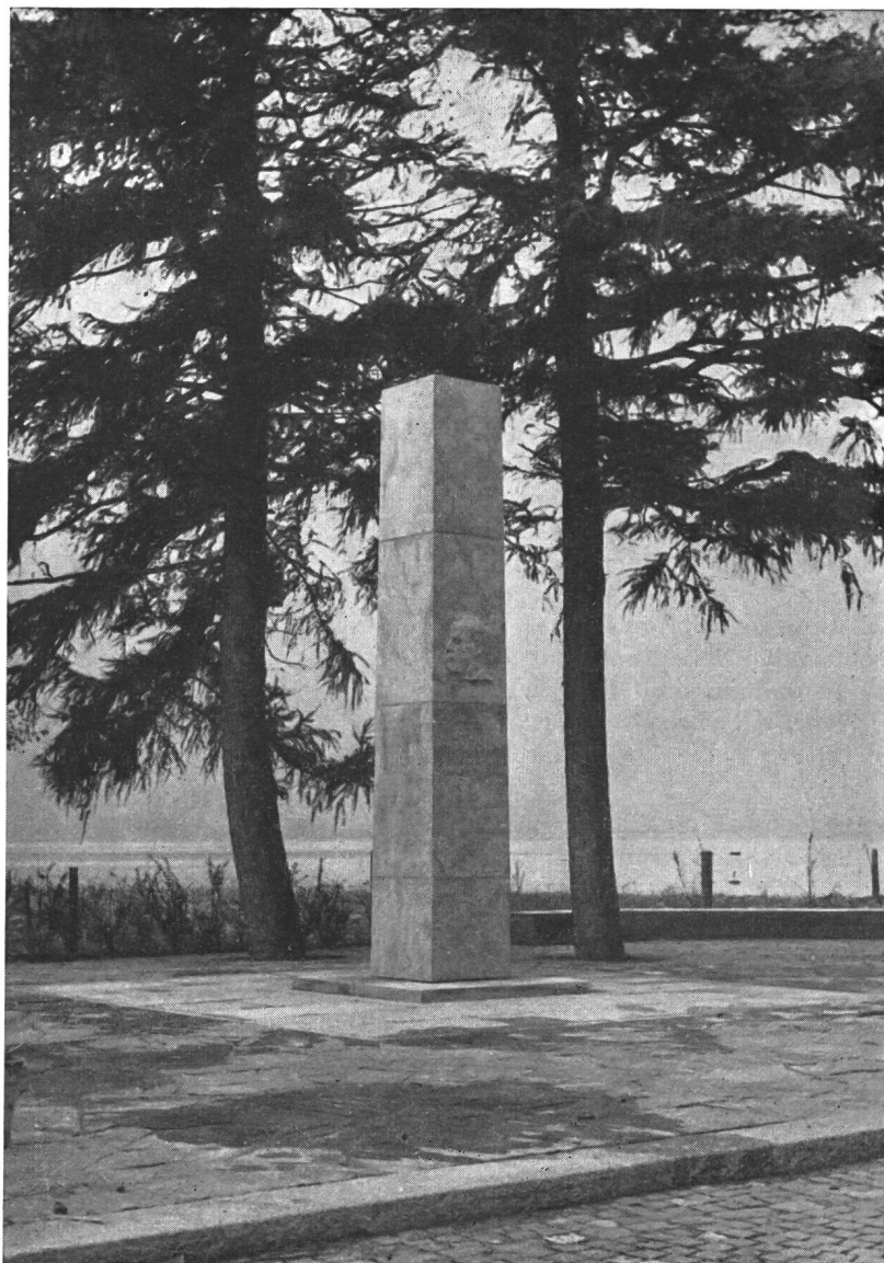
DAS DENKMAL HUBER-STOCKAR IN FLÜELEN