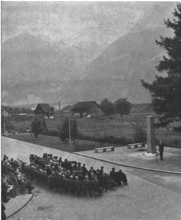
Fig. 6 Professor Dr. Max Huber während seiner Ansprache