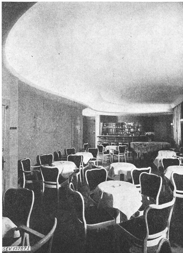
Fig. 9. Indirekte Beleuchtung einer Bar mit Hochspannungs-Fluoreszenzröhren

haltung von Hochspannungs-Leuchtröhren-Anlagen zu beachten sind 2) . Bei deren Befolgung ist die Gewähr für Betriebssicherheit und Gefahrlosigkeit auch von Hochspannungs - Fluoreszenzröhren - Anlagen geboten, wobei nicht ausgeschlossen ist, dass durch Material- oder Installationsfehler, genau wie bei Niederspannungs-Anlagen, Defekte mit den entsprechenden Folgen auftreten können.