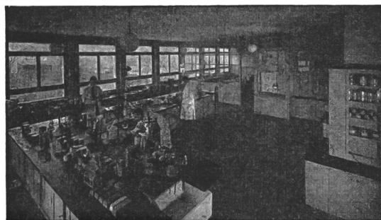
Fig. 1. Ausschnitt aus dem Forschungslaboratorium der Adolf Schmidts Erben A.-G., Bern

Daneben dürften auch die übrigen im Stand behandelten Themen (u. a. Altölregenerierung) das Interesse der Besucher finden.