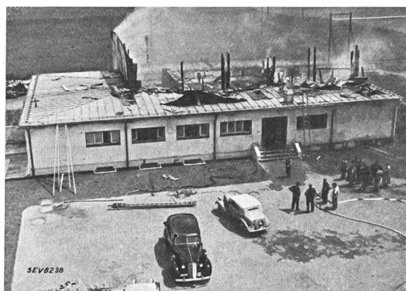
Fig. 2. Brand des Kurzwellensenders Schwarzenburg. Gesamtansicht. 6. Juli 1939.

Zu den Kontrollpflichten der Ueberwachung nach Emissionsschluss gehört u. a. die sorgfältige Ueberprüfung aller in der gefährdeten Zone (im vorliegenden Fall also hauptsächlich das Transformatorenpodest und die Antennenzuleitung) gelegenen Anlageteile. Diese Kontrolle wurde auch in der kritischen Nacht ausgeführt und ergab keinerlei abnormale Feststellungen.