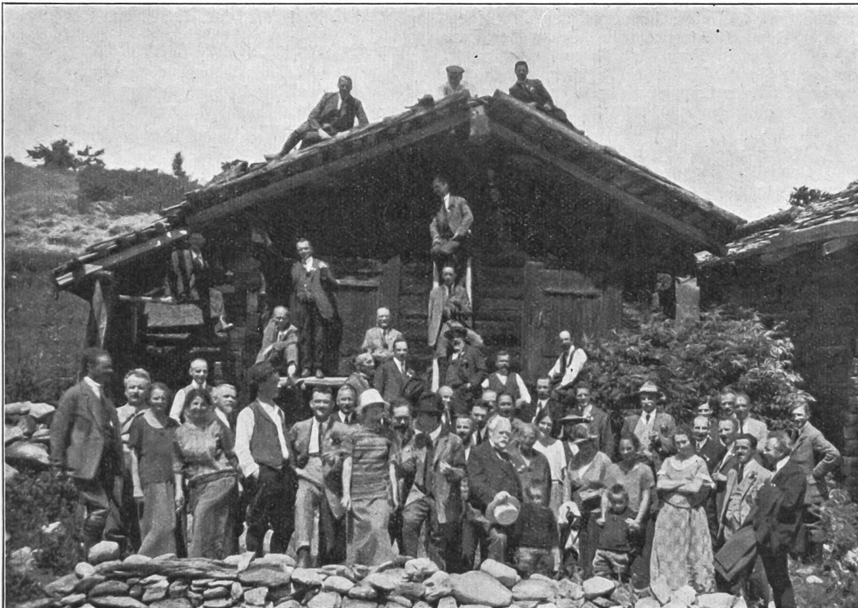
Teilnehmer an der Exkursion Turtmann-Ober-Ems (Generalversammlungen 1924).

dungen, in einem Masse, das man heute nur selten jemandem zumuten könnte, tage-, nächte-, wochenlang war das Familienleben und die beschauliche Abendruhe dahin und ein ununterbrochenes Sichhingeben an den Beruf und die Pflicht beherrschte sowohl den obersten Leiter wie auch den letzten