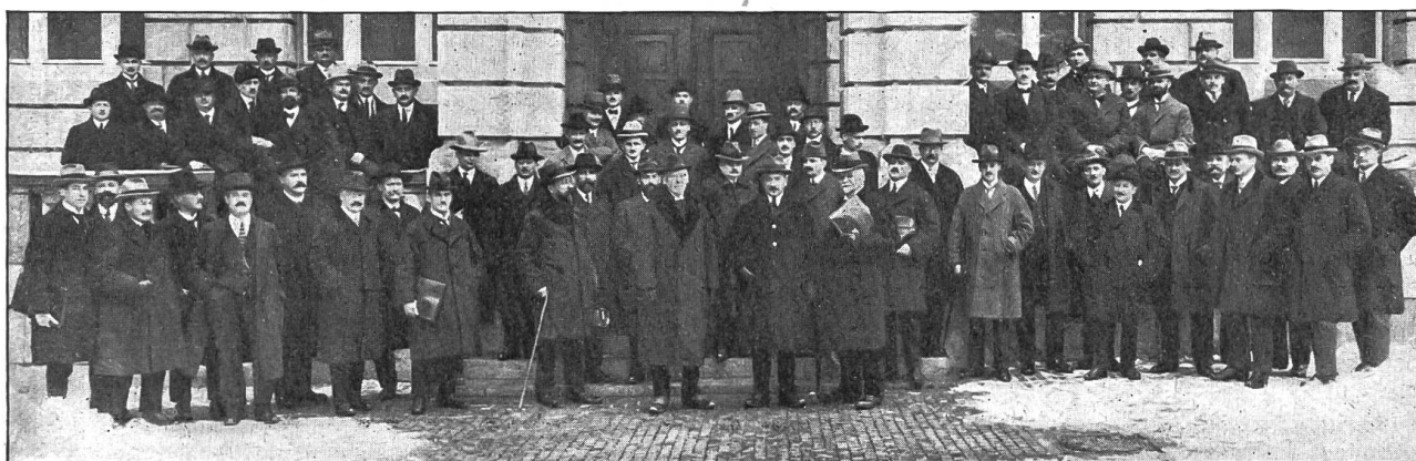
Kursteilnehmer am 26. Januar 1923.

Nicht nur die Vorträge im Polytechnikum, sondern auch das gemeinschaftliche Mittagessen