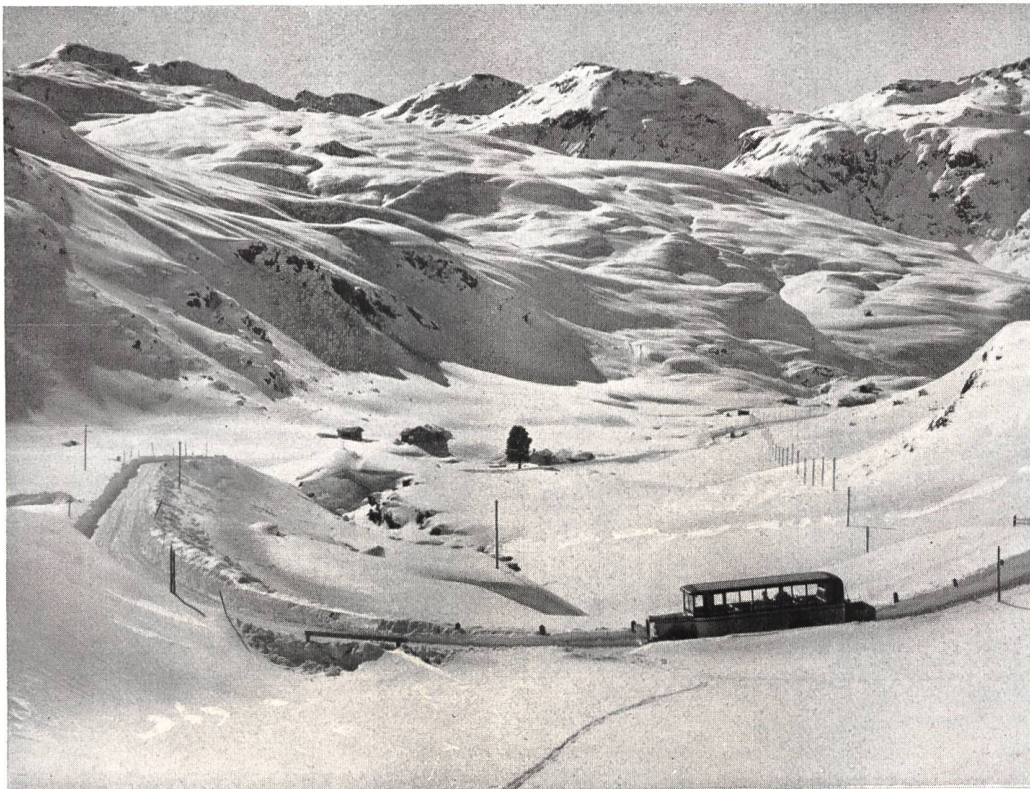
Julierstrasse im Winter offen. - Partie oberhalb Bivio.