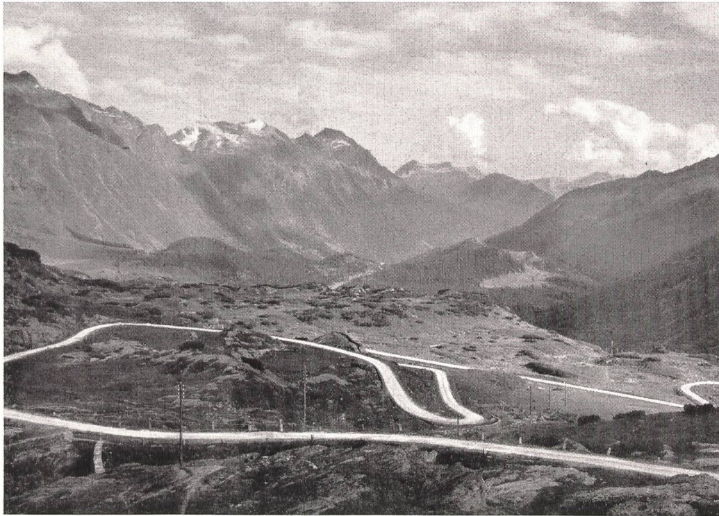
Phot. Alb. Steiner, St. Moritz. Blick von der S. Bernhardin-Passhöhe gegen Misoxtal.