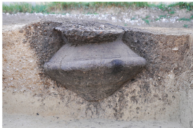
4 Orbe – Chemin de l'Étraz 18. La tombe ST 4 en cours de fouille, vue en coupe. La fosse, de forme circulaire, est ajustée aux dimensions de l'urne.

Qu'il s'agisse d'inhumations ou de crémations, les tombes sont généralement individuelles, les sépultures doubles restant exceptionnelles. Les crémations sont majoritaires sur l'ensemble du territoire. Elles sont constituées des restes du défunt collectés sur le bûcher et déposés dans une urne en céramique, accompagnés d'objets variés (vases, parures) et parfois d'offrandes alimentaires. La pratique de l'inhumation se poursuit discrètement, elle n'est majoritaire qu'à Tolochenaz. On peut souligner la grande variabilité des mises en scène des dépôts et des architectures funéraires, qui nous renvoient l'image d'une forte personnalisation de la sépulture.