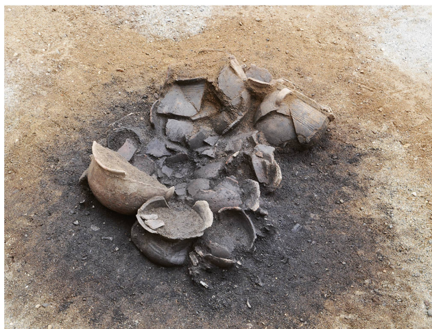
7 Lausanne-Vidy – Bois-de-Vaux 22. Détail du dépôt funéraire. Les résidus du bûcher, réunis dans un contenant en matière périssable, sont déposés au fond de la fosse. Au-dessus sont installés onze vases d'accompagnement, placés dans un autre contenant.

Lausanne-Vidy – Bois-de-Vaux 22. Detail der Bestattung. Die Scheiterhaufenreste wurden in einem Behälter aus vergänglichem Material auf der Sohle der Grabgrube niedergelegt. Darüber wurden elf Beigabengefässe in einem weiteren Behälter platziert.