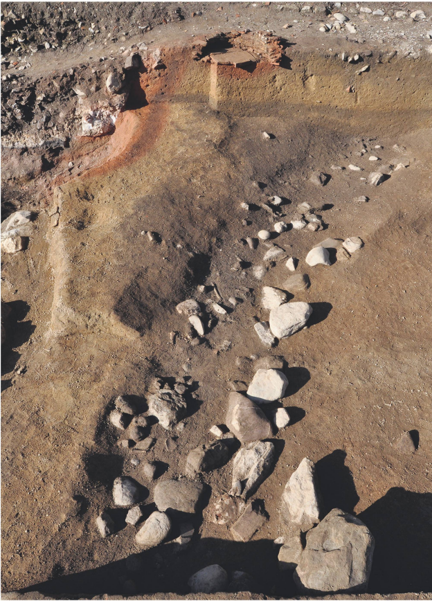
3 Blocs de calage et dépôts du fossé extérieur. Phase 3 (milieu du 1 er s. av. J.-C.).

Keilblöcke und Depots im äusseren Graben. Phase 3 (Mitte des 1. Jh. v. Chr.).