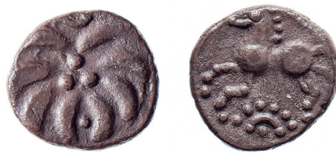
6 Quinaire au rameau découvert à Bière (VD), diffusé en Suisse occidentale et septentrionale, territoire présumé des Helvètes. Type F2a, diamètre 11.9 mm, MMC43750.

Si ce ne sont pas les Helvètes, alors qui occupait la partie ouest du plateau suisse pendant le 2 e siècle et auparavant? Il pourrait s'agir d'une ou de plusieurs tribus liées à la confédération des Séquanes, un autre peuple celte, qui s'étendait peut-être de part et d'autre de la chaîne du Jura. Quant aux Helvètes, si leur nom est attaché à l'unité de la Suisse pour des questions politiques qui n'ont rien à voir