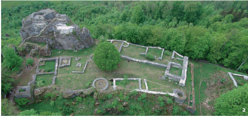
Fig. 2 Les ruines du château de Frohburg, au-dessus de Trimbach, sont un but d'excursion apprécié.

Le rovine del castello di Frohburg sopra Trimbach sono una meta molto apprezzata per le passeggiate.