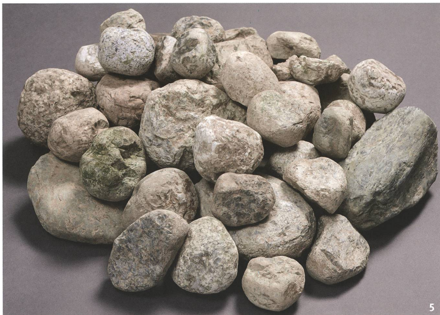
Fig. 5 Amas de percuteurs et bouchardes trouvés en grande quantité sur le site et destinés à la production de lames de hache polies.

Zahlreiche Ansammlungen von grösseren und kleineren Klopsteinen in der Fundstelle zeugen von der Herstellung von Beilklingen aus Felsgestein.