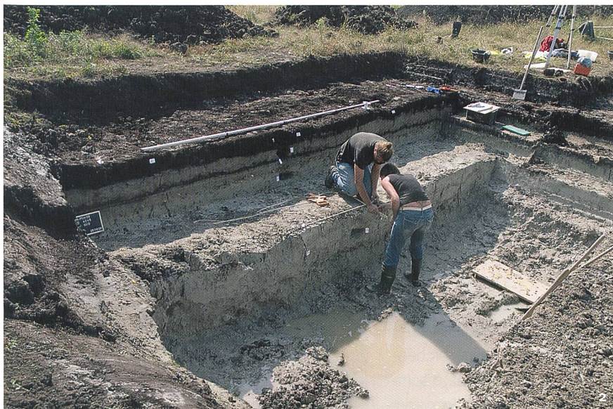
Fig. 2 Prélèvement des sédiments à Cornaux – Prés du Chêne, dans les déposits de l'ancienne Thielle.

Prelievo dei sedimenti di Cornaux – Prés du Chêne, nei depositi dell'an- tica Thielle.