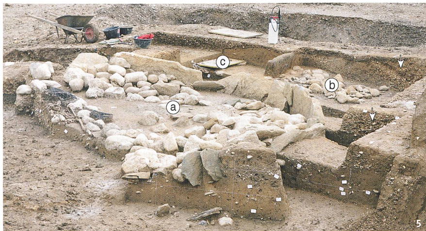
Fig. 5 Colombier – Les Plantées de Rive: les structures funéraires du Bronze moyen en cours de dégagement (a tumulus; b tombe à incinération; c tombe à inhumation). Le cordon littoral (flèches) qui les recouvre matérialise la dégradation climatique majeure du Bronze moyen.

Colombier - Les Plantées de Rive: le strutture funerarie del Bronzo medio in corso di scavo (a tumulo, b tomba ad incinerazione, c tomba a inumazione). Il cordone litoraneo (freccia) che li ricopre indica l'intenso peggioramento climatico del Bronzo medio.