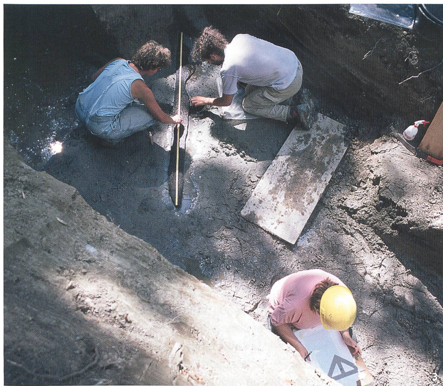
Fig. 3 Fouilles de La Tène en août 2003. Dégagement d'une planchette datée par dendrochronologie de 3824 av. J.-C. (Néolithique).

Scavi di La Tène nell'agosto del 2003. Viene portata alla luce un'asse datata al 3824 a.C. (Neolitico).