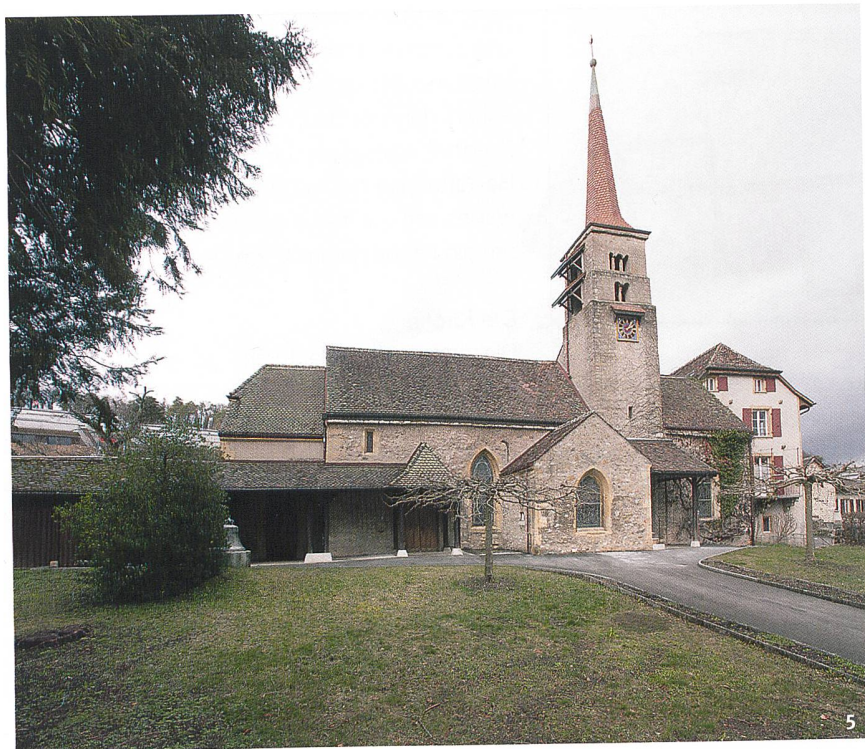
Abb. 5 Die Kirche mit ihrem romanischen Glockenturm.